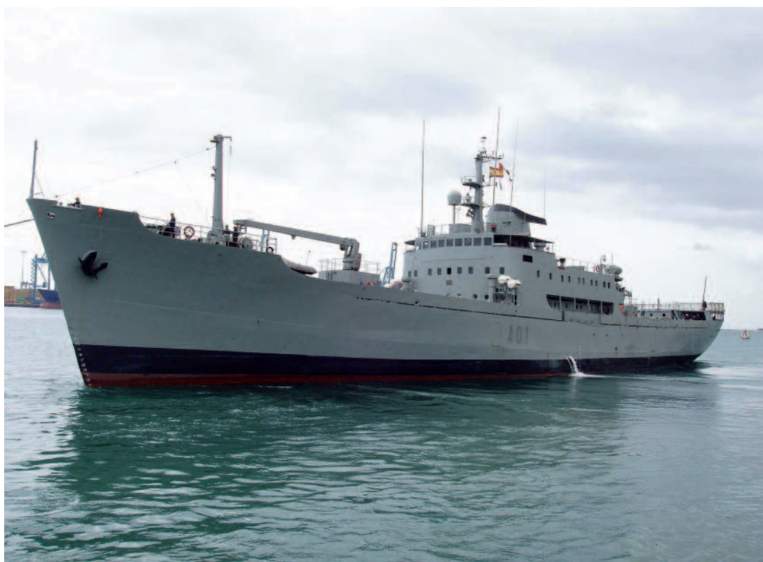
A01 CONTRAMAESTRE CASADO