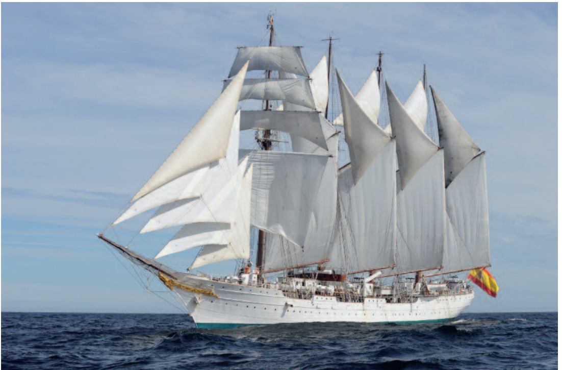
A71 JUAN SEBASTIÁN DE ELCANO