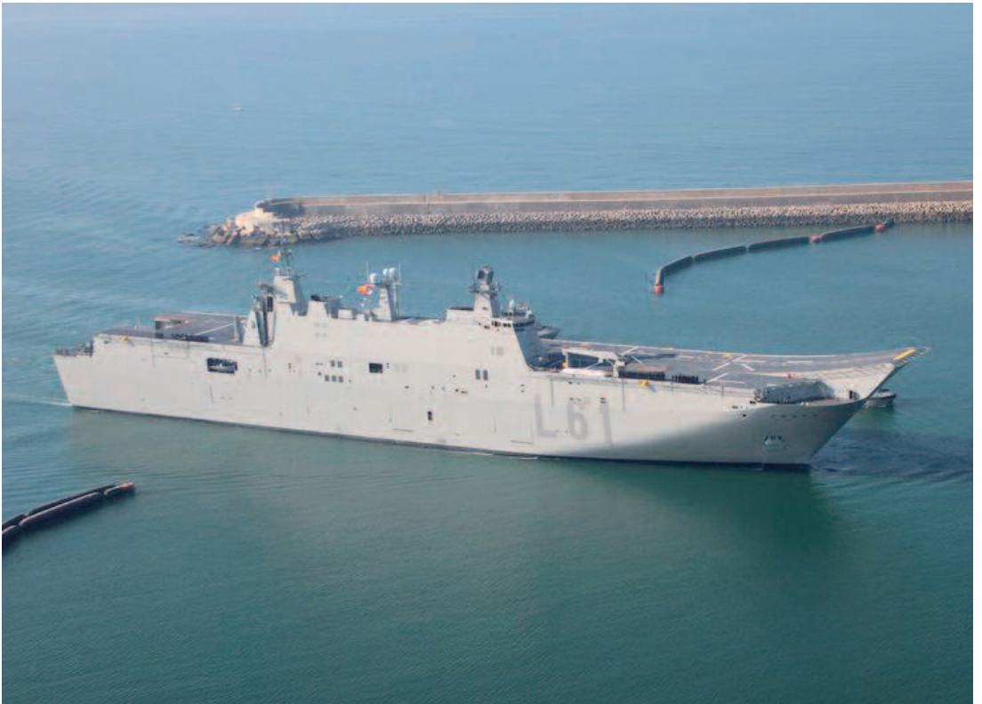
L61 JUAN CARLOS I