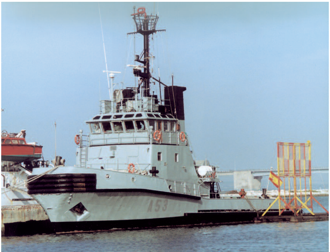
A53 LA GRAÑA