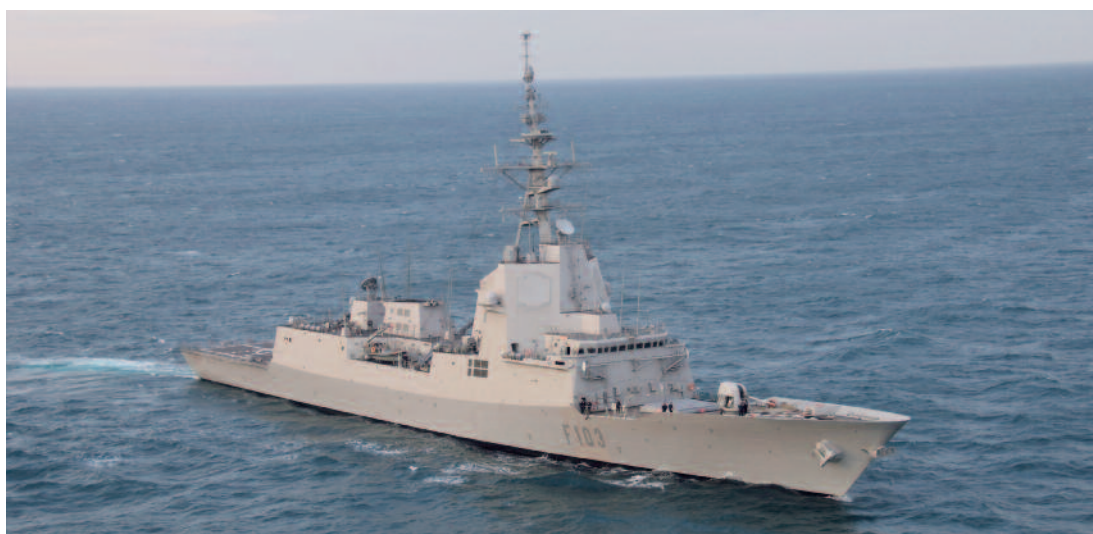
F103 BLAS DE LEZO