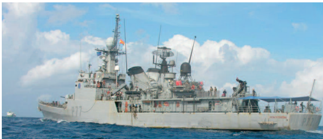
P77 INFANTA CRISTINA