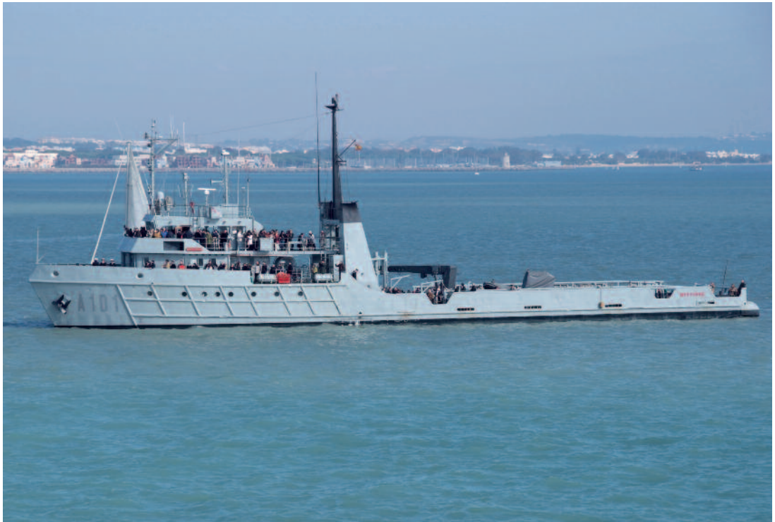
A101 MAR CARIBE