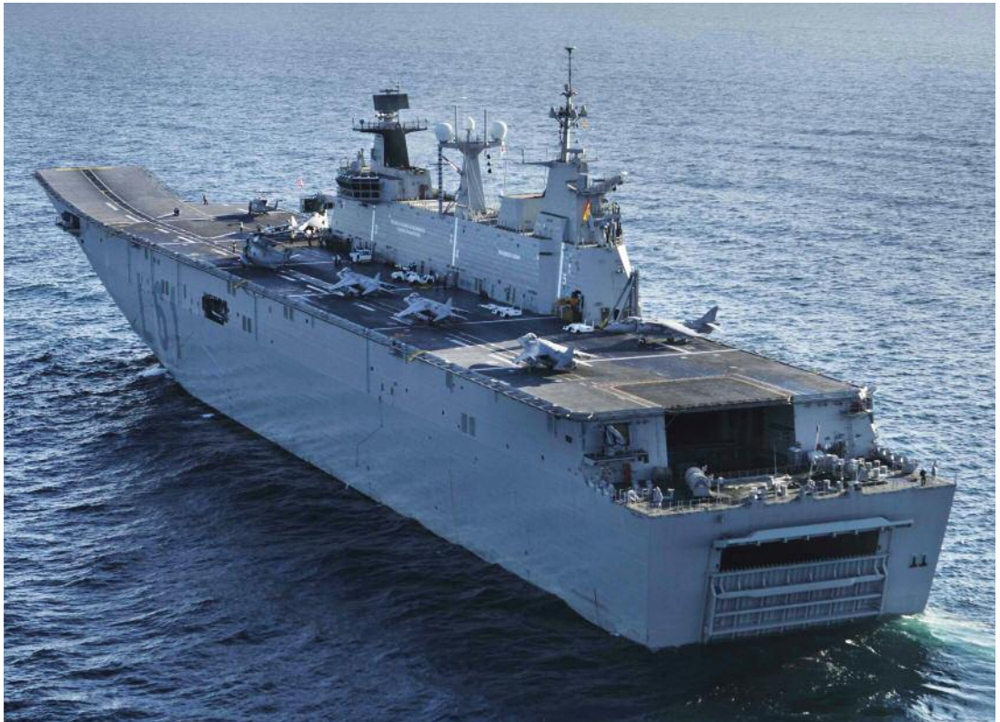
L61 JUAN CARLOS I