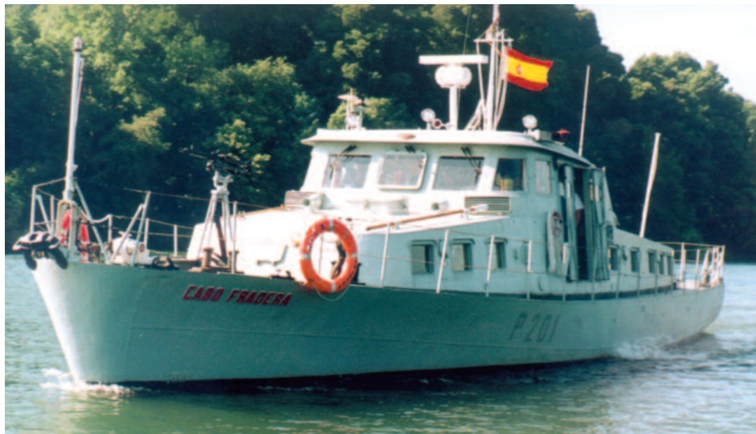
P201 CABO FRADERA