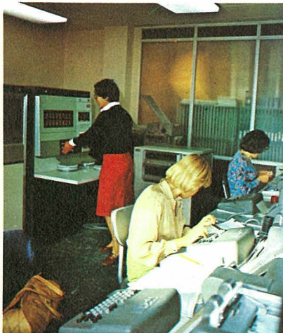
Unidad Central de grabación.