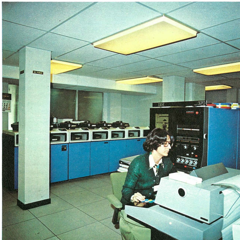
Ordenador Central IBM - 370/135.

Instalaciones del Centro de Cálculo de la JAL.