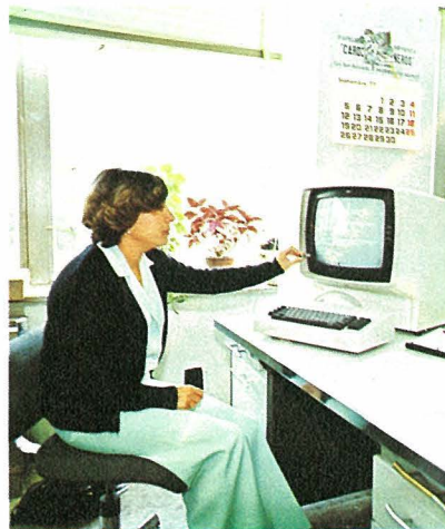
Terminal IBM 3270 del Servicio de Repuestos

que puedan existir y, finalmente, obtener, mediante los programas adecuados, los listados de explotación que necesitan los usuarios. Esto, como se puede ver, es trabajo constante y pesado.