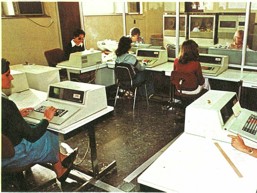
Vista parcial de la sala de grabación