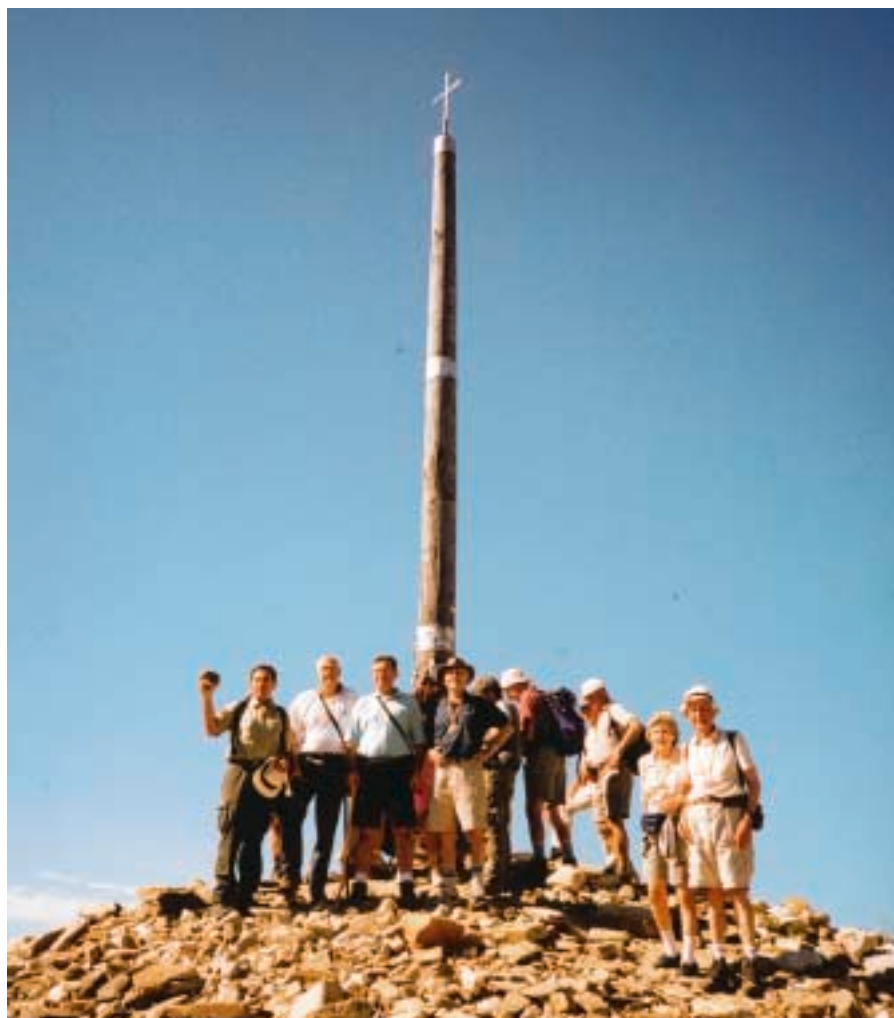
Grupo de peregrinos de la Armada en la Cruz de Hierro.

que asistieron distintas personalidades. En ella se mostraban al visitante los quince años de vida y camino de la Orden. Se expusieron objetos, fotografías, donaciones de distintas asociaciones y, en general, desde sus comienzos, estampas de la historia de la Orden Militar en sus tres lustros de existencia.