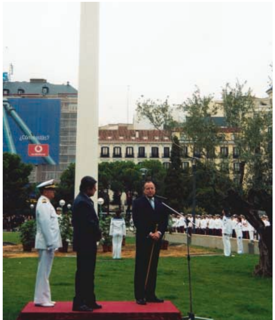
El alcalde de Madrid, José María Álvarez del Manzano, se dirige a los presentes en la ceremonia.

A las 10.30 una compañía de honores de Marinería del Cuartel General de la Armada y la Banda de Música de la Agrupa-