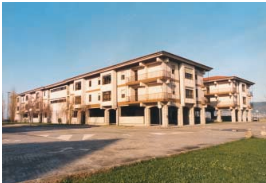
Pabellones de alumnos.

P.— Incidiendo un poco más en la dureza o exigencias que suponen los primeros meses en la Escuela, pienso que será el período de tiempo en el que se