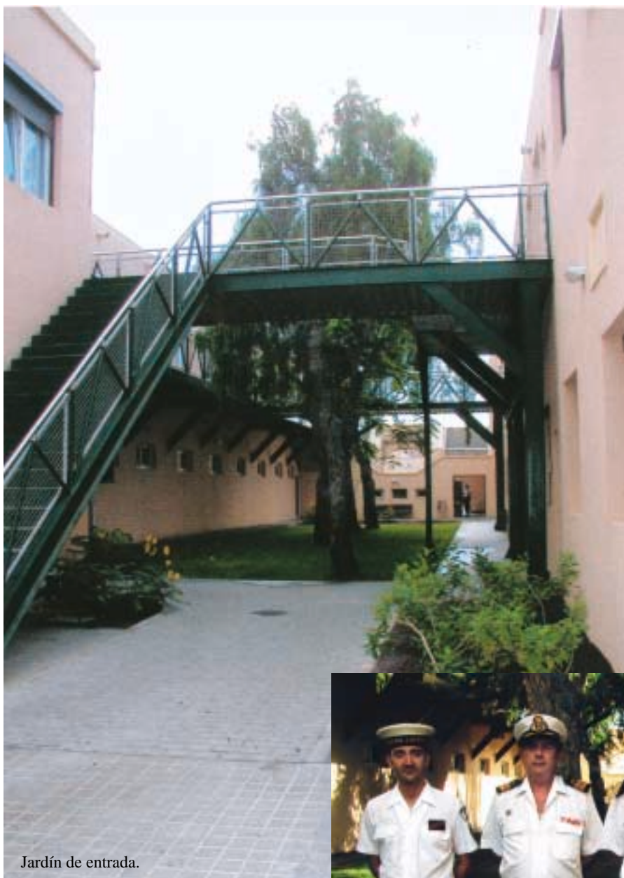
Jardín de entrada.

Cuenta con una capacidad de 150 plazas de alojamiento y tres vestuarios (uno femenino) para personal no residente destinado en unidades ubicadas en el arsenal, con un total de 188 taquillas.