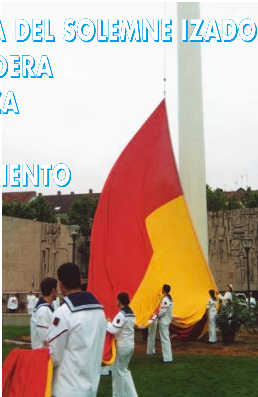
Momento del solemne izado de la bandera nacional.

La Armada fue, en parte, la causante de que hubiera que definir o diferenciar, de alguna manera, la enseña nacional, ya que las banderas nacionales o divisas que se usaban en las embarcaciones ocasionaban ciertos inconvenientes a la hora de ser identificadas a larga distancia o con viento calmoso con las de otras naciones. Fue ésta la principal causa que motivó la necesidad de la nueva promulga-