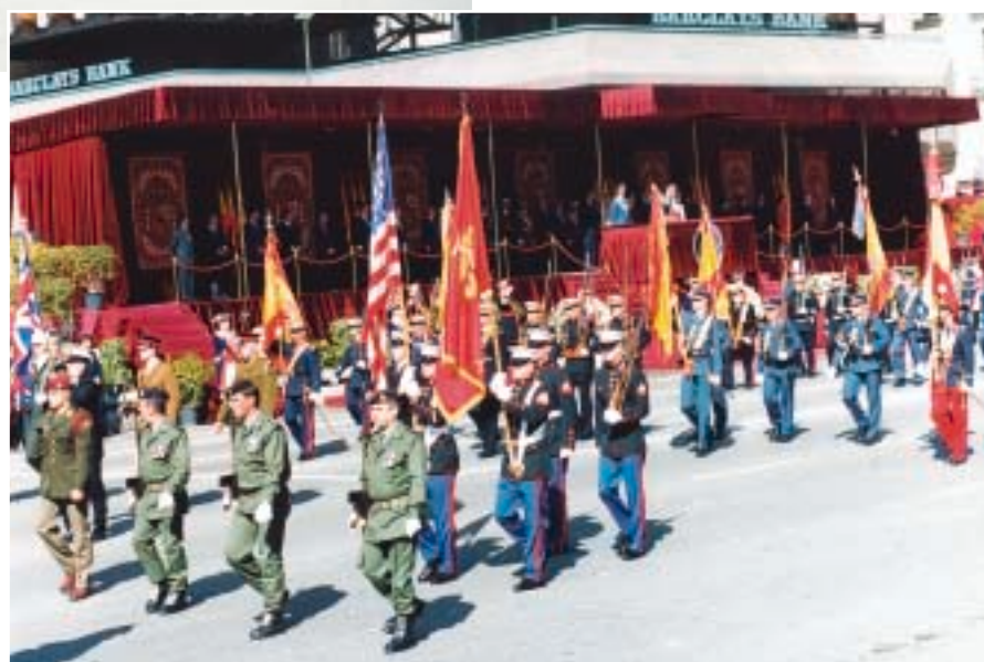
Paso de las banderas representantes de los países integrados en la OTAN.

Una vez finalizado el desfile de las fuerzas, el acto de arriado