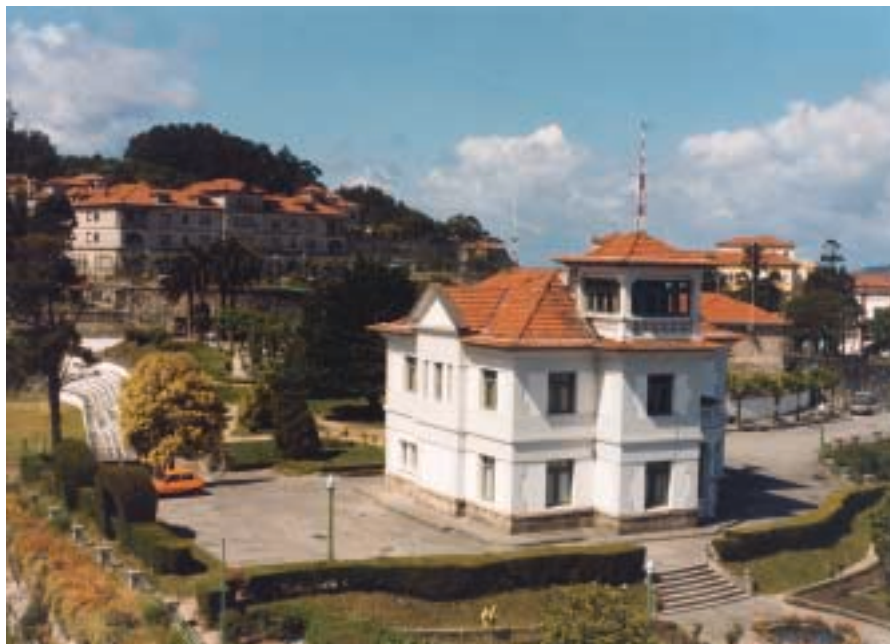
Algunas dependencias de la Escuela Naval. En la fotografía vemos la casa del Comandante Director y detrás, la residencia de oficiales.

El sexto eje importantísimo también debe estar representado