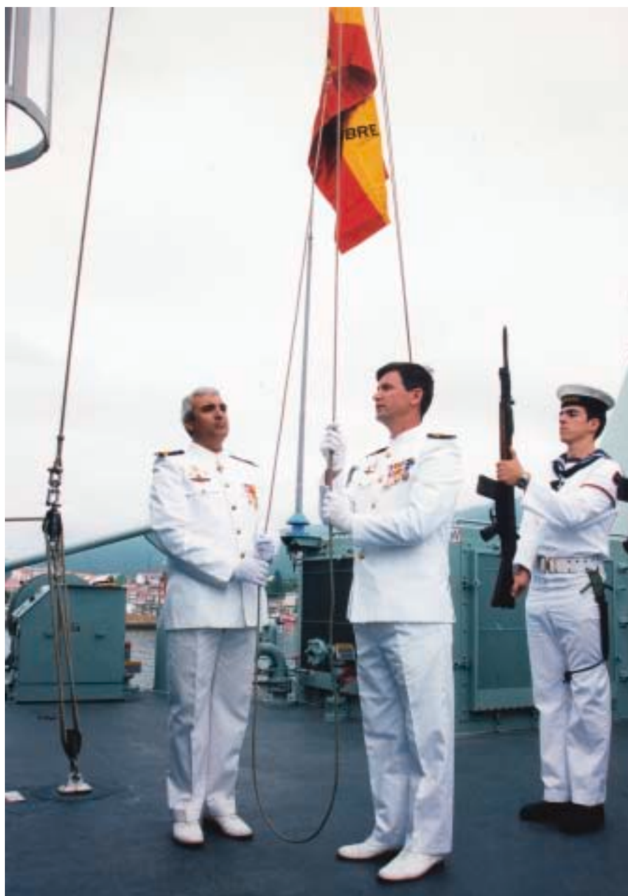
Momento del izado de la bandera a bordo del cazaminas Tambre por parte de su comandante.

los que peregrinan a esta hermosa tierra gallega, para que, como hemos podido comprobar, se encuentren como en su casa. Finalmente, con la representación de las aguas de un río demuestra su hermandad con las del Tambre.