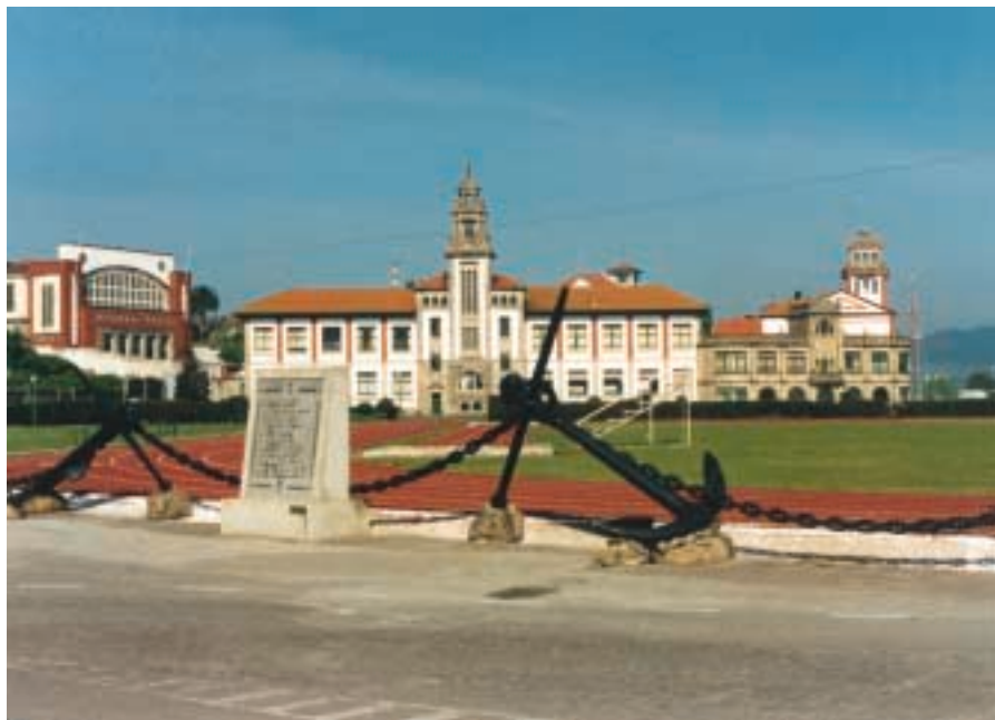
Panorámica de la Escuela Naval.

voluntarios que se han acercado estos días para aportar su granito de arena en la ardua lucha contra el «chapapote»; mi misión entonces consistía en presentar la imagen actual de nuestra Escuela Naval.