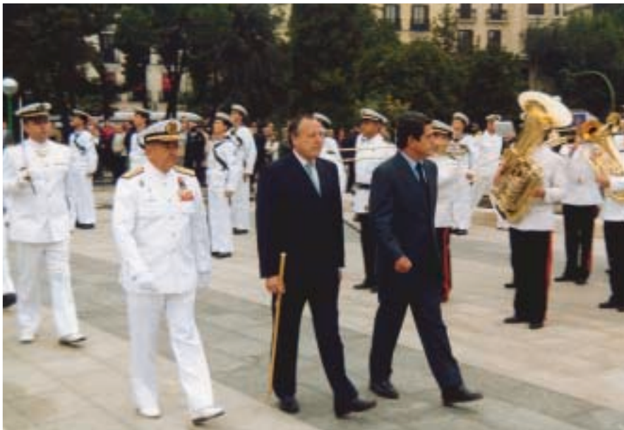
Las autoridades que presidieron la ceremonia revisitan las fuerzas que rindieron los honores de ordenanza.