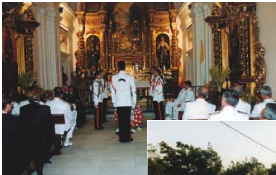
Interior de la capilla del cementerio de San Isidro, donde se celebró un acto religioso, seguido de la entrega oficial de los restos a la Armada por parte de la Armada.

Con la llegada del almirante general jefe del Estado Mayor, Francisco Torrente Sánchez, quien presidió la ceremonia (toda vez que el ministro de