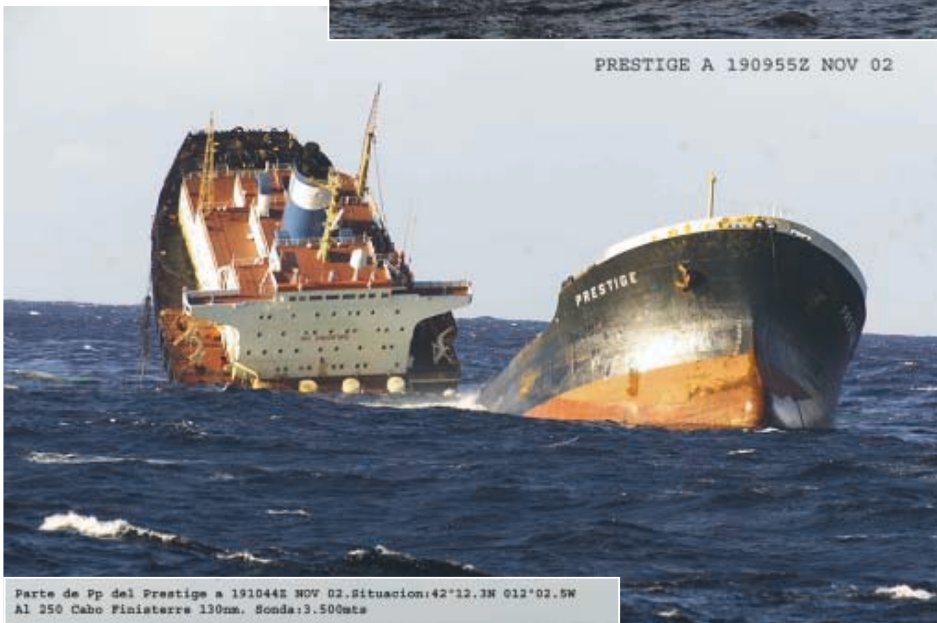
Parte de Pp del Prestige a 191044Z NOV 02. Situación: 42°12.3N 012°02.5W Al 250 Cabo Finisterre 130nm. Sonda: 3.500mts