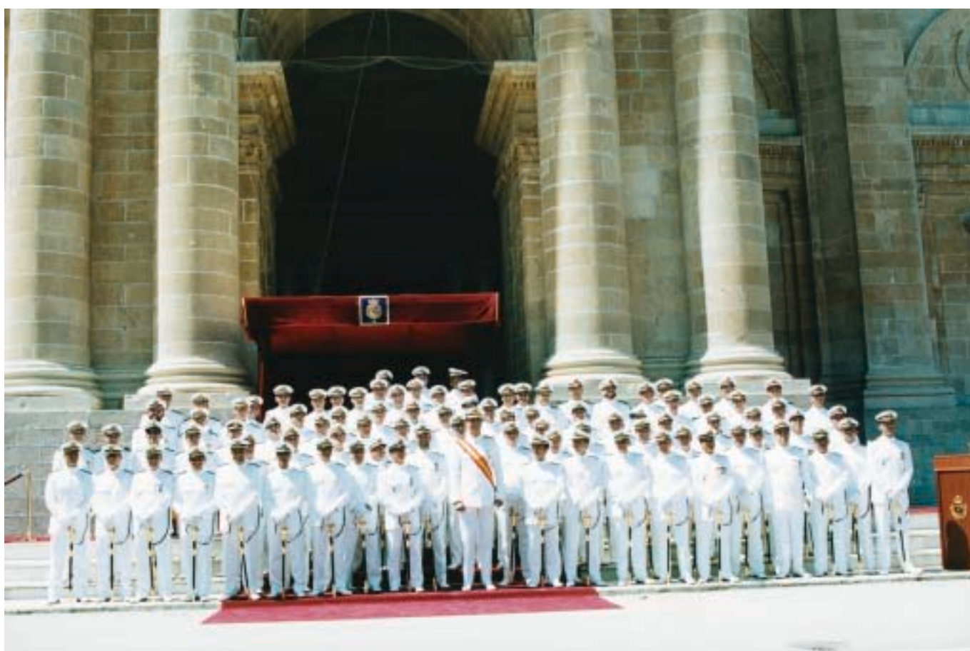
Foto oficial de toda la promoción con S.A.R. el Príncipe de Asturias.