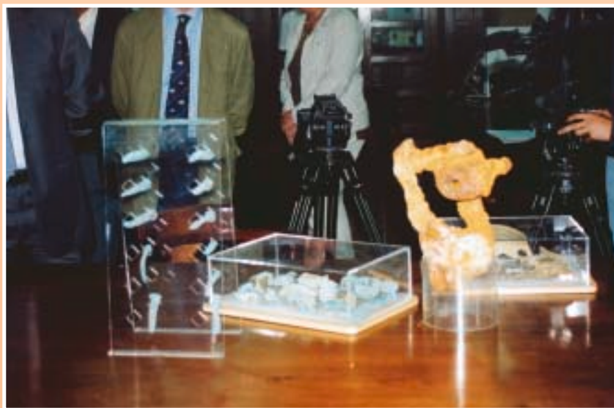
Restos del pecio entregado por la Autoridad Portuaria al Museo Naval de Ferrol.