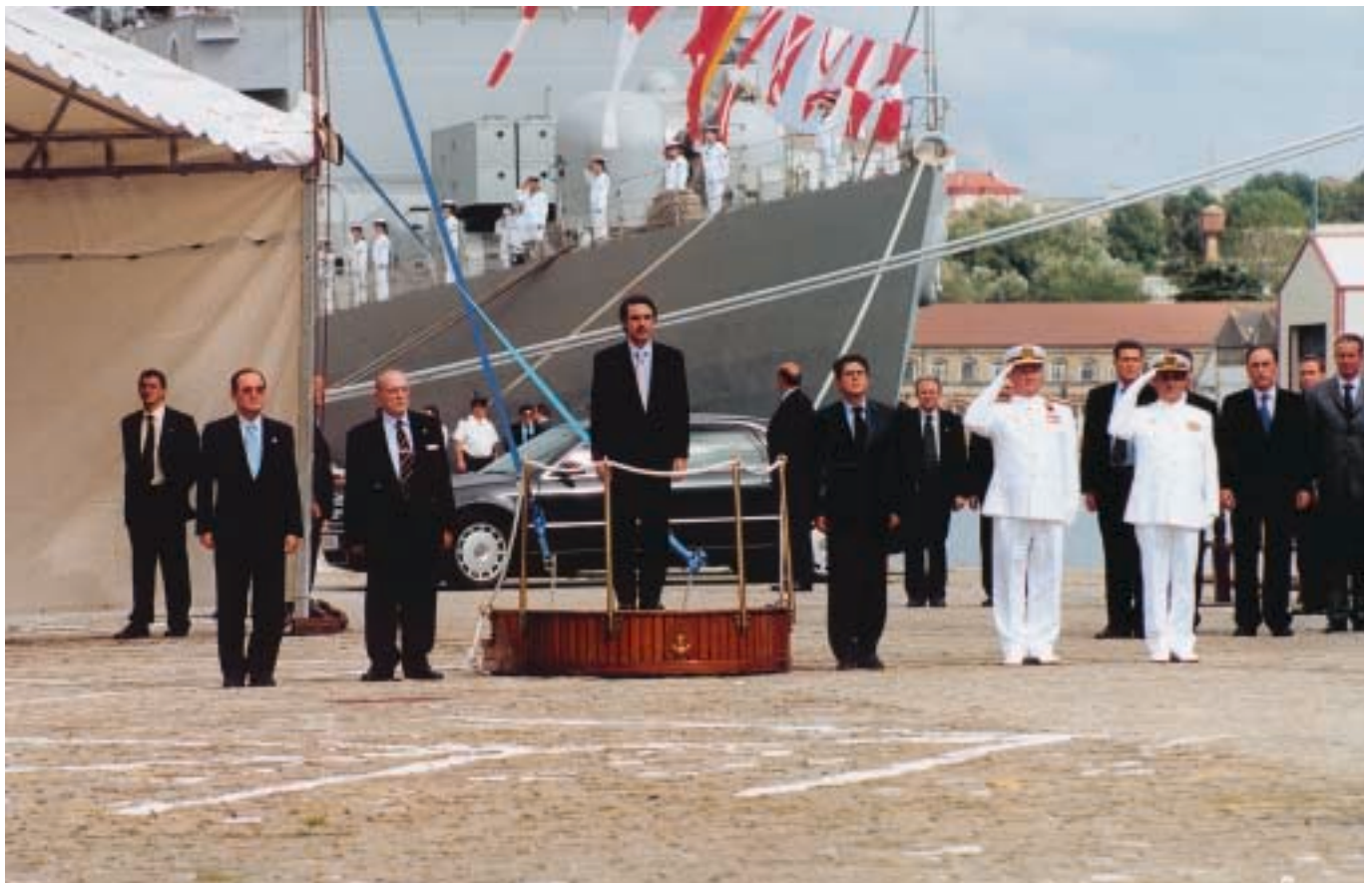
Solemne izado de la Bandera en presencia de las altas autoridades en la F-101 Álvaro de Bazán .