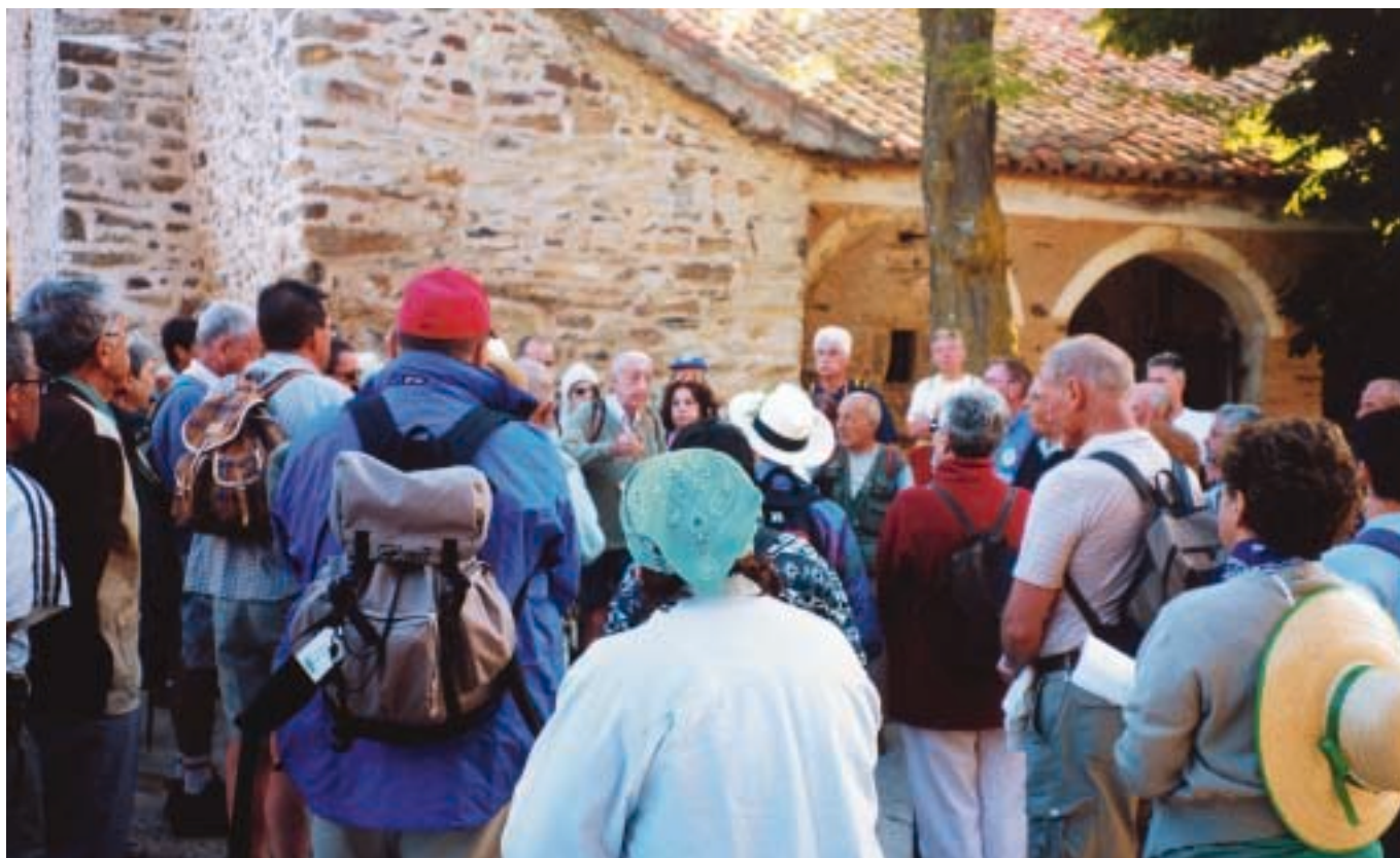
Una parada en Rabanal del Camino.