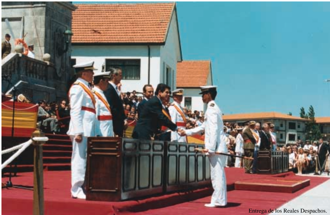
Entrega de los Reales Despachos.

ciones 402. a del Cuerpo General de la Armada, 132. a de Infantería de Marina, 12. a del Cuerpo de Ingenieros y 77. a del Cuerpo de Intendencia, y los de la Escala de Oficiales, pertenecientes a la 10. a promoción del Cuerpo General, 11. a de Infantería de Marina y a la