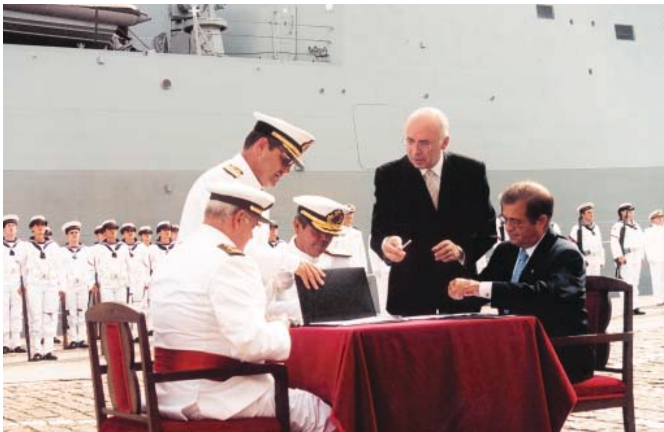
Firma de entrega a la Armada por parte de representantes de la empresa IZAR y de la Armada.