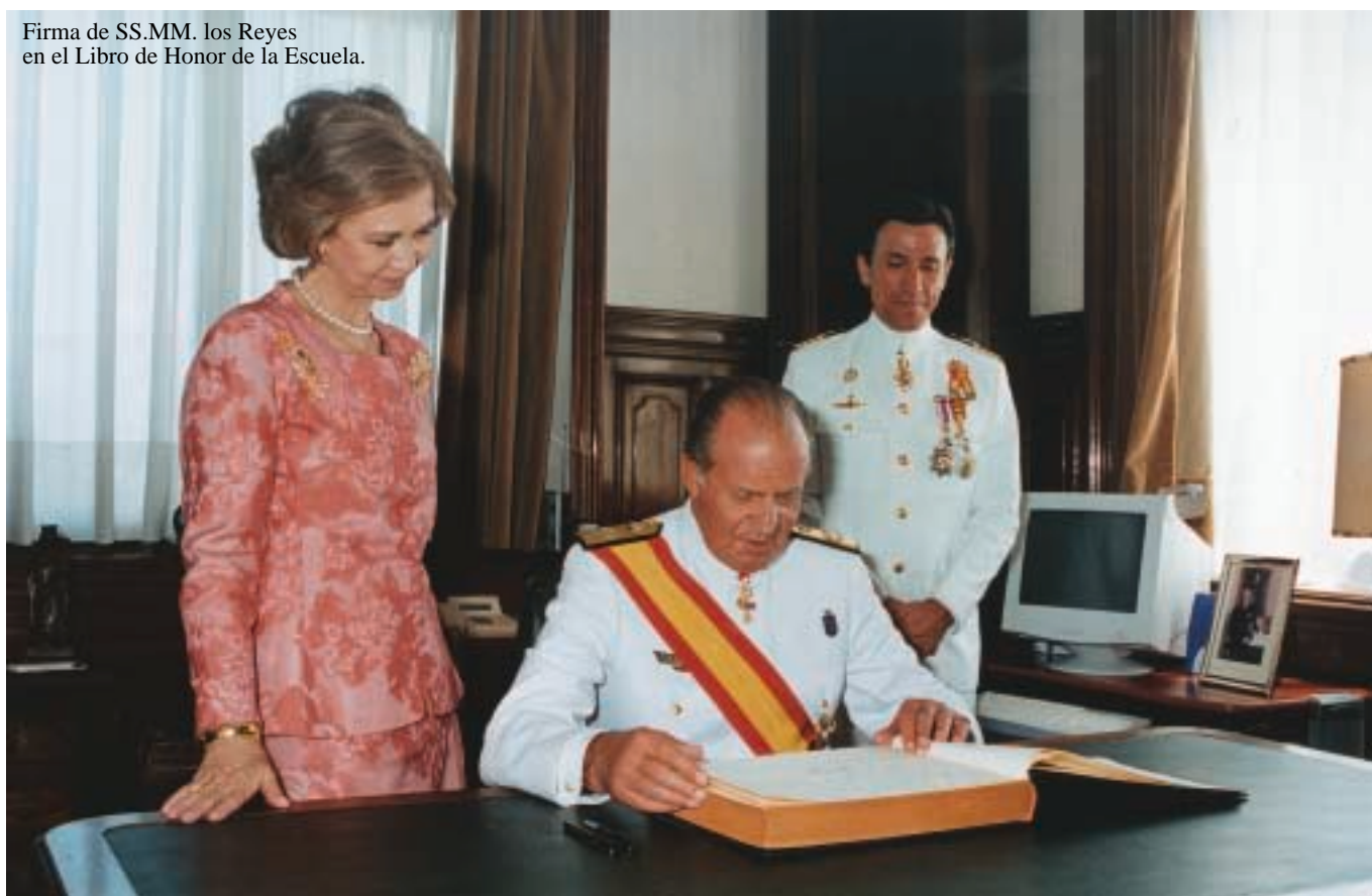
Firma de SS.MM. los Reyes en el Libro de Honor de la Escuela.

Tras la alocución del Sr. CN. Comandante Director y el desfile del Batallón de Alumnos, SS. MM. los Reyes se dirigieron al edificio de dirección, donde firmaron en el Libro de Honor de la Escuela.