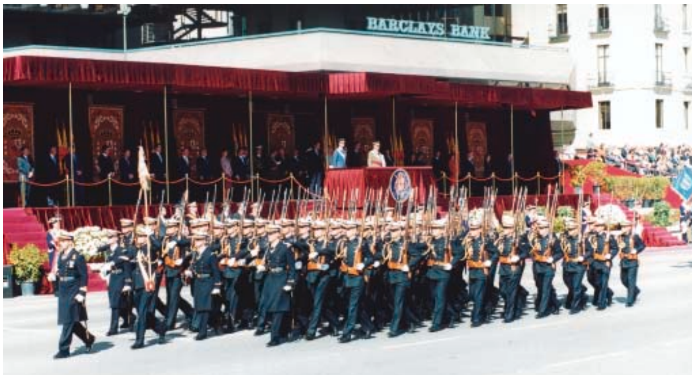
Desfile ante SS.MM los Reyes del Batallón de Alumnos de la Escuela Naval Militar.