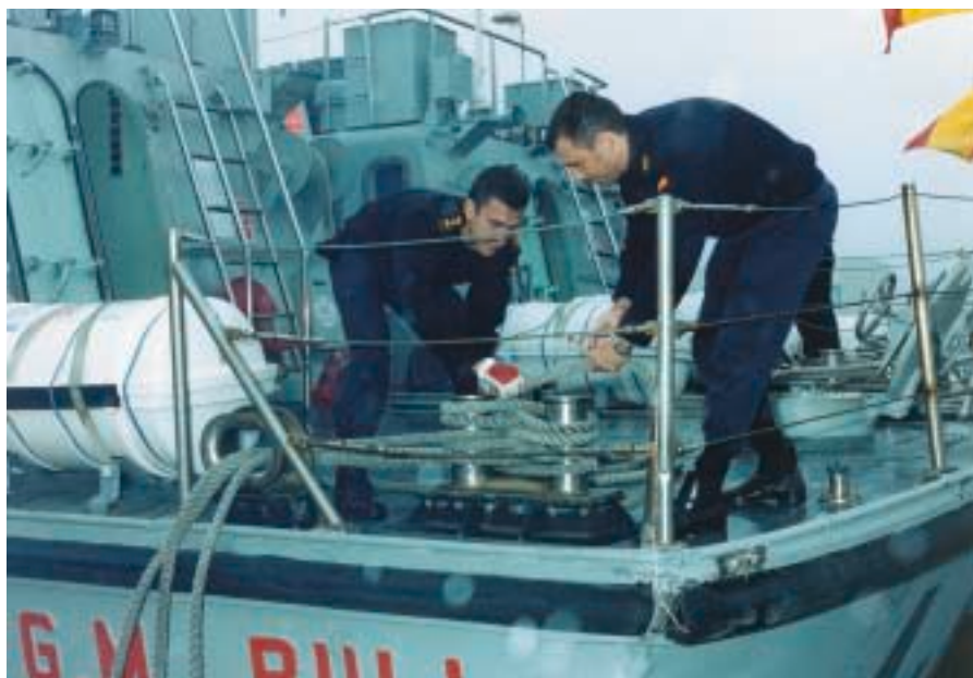
Clases prácticas a bordo de unidades de la Armada.

En síntesis, cabría decir que hoy la Escuela Naval forma alumnos más integrados, más completos, más eficientes, con una amplia base de conocimientos técnicos y profesionales, que les capacita para desarrollar ampliamente sus funciones a bordo de los buques y unidades de la Armada del siglo XXI.