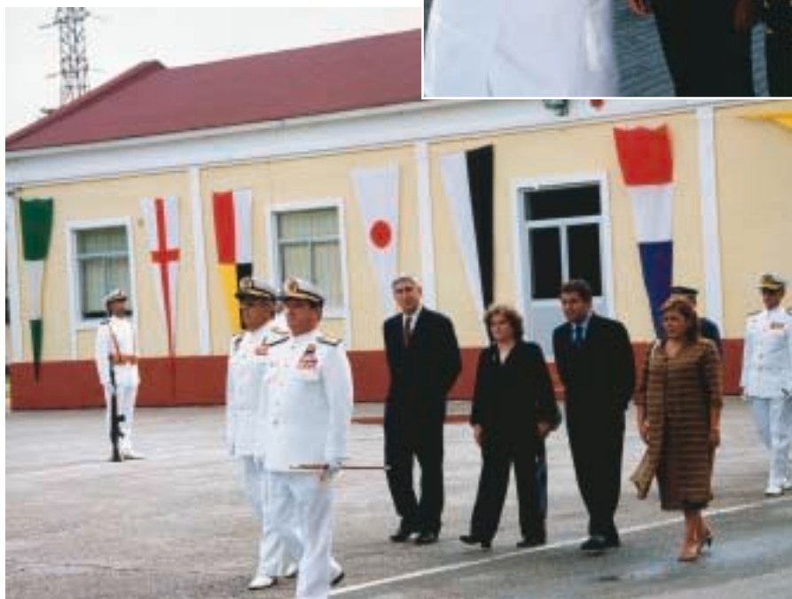
El almirante general jefe del Estado Mayor de la Armada presidió el cortejo fúnebre desde el Tercio de Armada hasta la Escuela de Suboficiales, siendo acompañado por los familiares y autoridades civiles y militares de la Armada, del Ejército de Tierra y del Ejército del Aire.

Al término del panegírico, y ya en el interior del templo, tuvo lugar el rezo de un responso y la posterior colocación de una corona de flores de parte del AJEMA ante la urna, tras ser inhumados los restos, mientras en la explanada de la Escuela sonaba una descarga de fusilería.