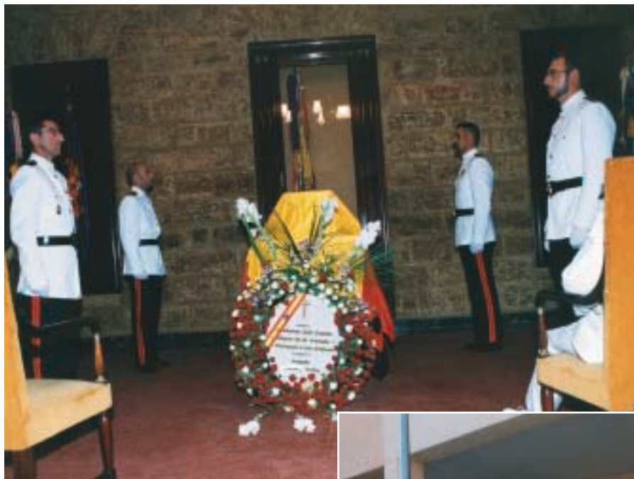
Los restos mortales del almirante Miranda y Godoy, tras su traslado a San Fernando, fueron velados en el TEAR hasta su inhumación en el Panteón de Marineros Ilustres.

insigne don Augusto Miranda, llegaría a la máxima responsabilidad dentro de la Armada, al ocupar el cargo de jefe del Estado Mayor de la Armada (AJEMA) entre los años 1990-1994. Posteriormente las compañías de honores desfilaron ante el armón con los restos.