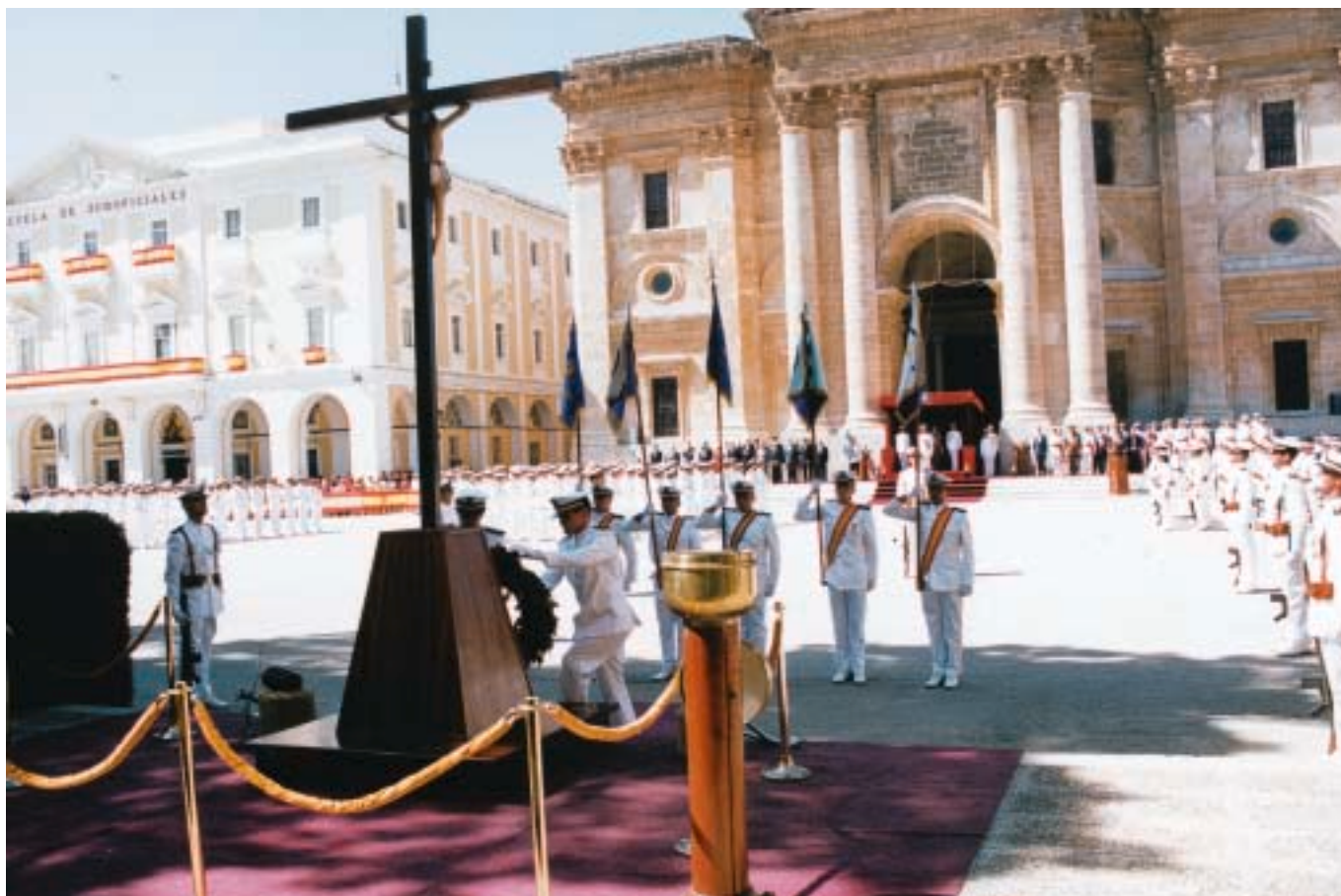
Celebración del Homenaje a los Caídos.