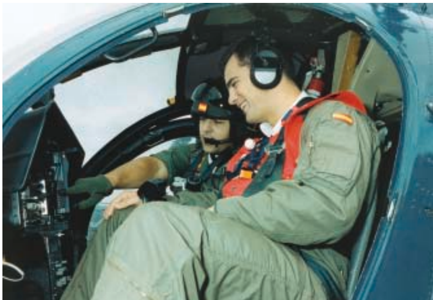
Clases prácticas en helicópteros de la FLOAN.

Armada: ejemplar, serio, moderno, adaptado a las nuevas realidades, y del que todos nos sintamos orgullosos.