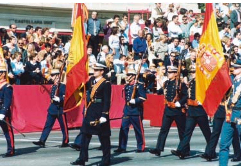
Desfile de las banderas de los tres Ejércitos.

La Armada estuvo representada por una formación de cuatro aviones Harrier AV-8B, un batallón de alumnos de la Escuela Naval Militar, bajo al mando de un oficial superior; una compañía de alumnos de la Escuela de Suboficiales; un