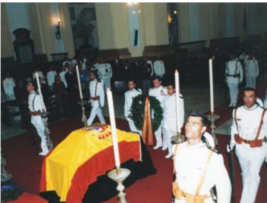
Interior del Panteón, donde se rezó un responso antes de la inhumación de los restos mortales.