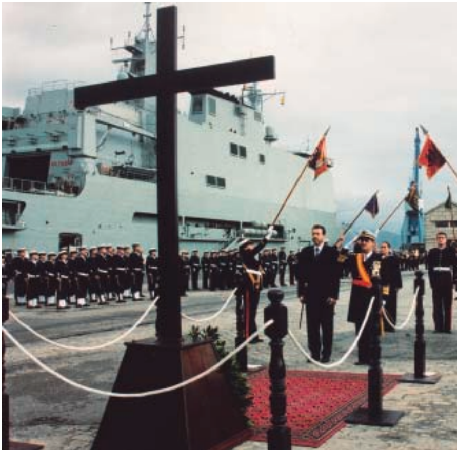
Homenaje a los Caídos en la Legendaria Batalla de Rande, que tuvo lugar hace hoy trescientos años en la ría de Vigo.