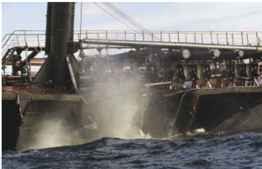
PRESTIGE A 190955Z NOV 02

tráfico marítimo en la zona de Finisterre, con objeto de fortalecer los mecanismos de control y patrulla, según el acuerdo alcanzado recientemente por los Gobiernos de Francia y España. Tal acuerdo prevé el reforzamiento de las medidas de seguridad en aguas de las respectivas zonas económicas exclusivas, y será de aplicación a los buques petroleros dedicados al transporte de fuel y alquitranes con más de quince años de servicio.