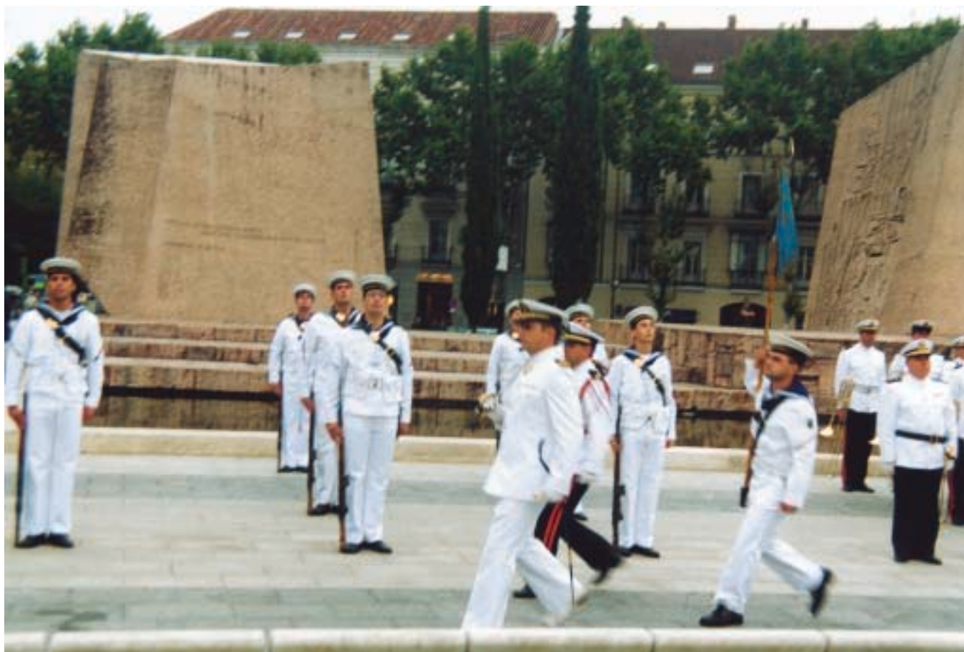
Desfile de las fuerzas ante el público asistente.

pasaron a ocupar el lugar de la presidencia, desde donde la compañía de honores del Cuartel General designada a tal efecto, y a los acordes del Himno Nacional, entonado por la Banda de Infantería de Marina de la AGRUMAD, formaba una larga fila sujetando por ambos lados la inmensa bandera, que iba a ser desplegada poco a poco hasta culminar su izado en lo alto del mástil, donde permanecería anclada, ondeando al viento, como símbolo indiscutible de nuestra nación. El ministro de Defensa y el alcalde de Madrid, una vez finalizado el izado, pronunciaron ambos unas emotivas palabras. En primer lugar, don José María Álvarez del Manzano quien se dirigió a todos los allí presentes destacando la importancia del acto, celebrado junto a todos los ciudadanos de la capital como clara alusión a la unión de todos los