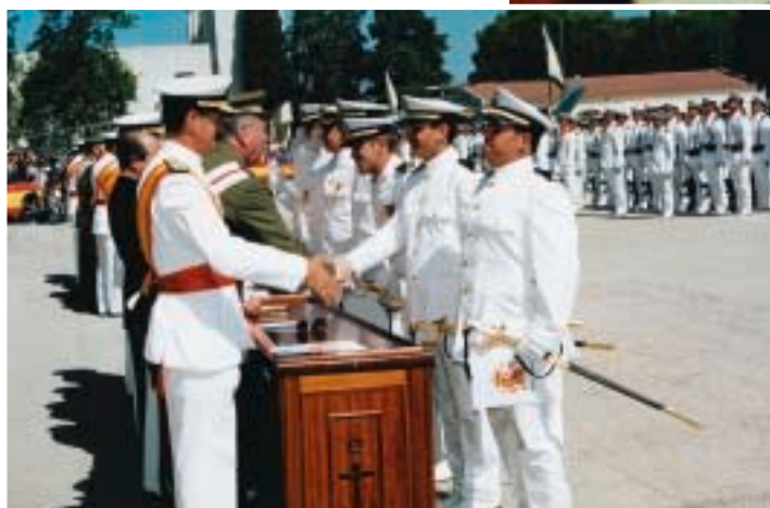
Entrega de Reales Despachos a distintos miembros.