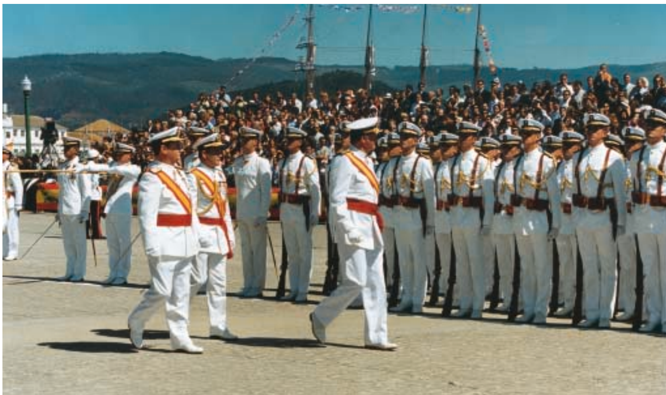
S. M. el Rey pasa revista a la Compañía de Alumnos de la Escuela Naval.