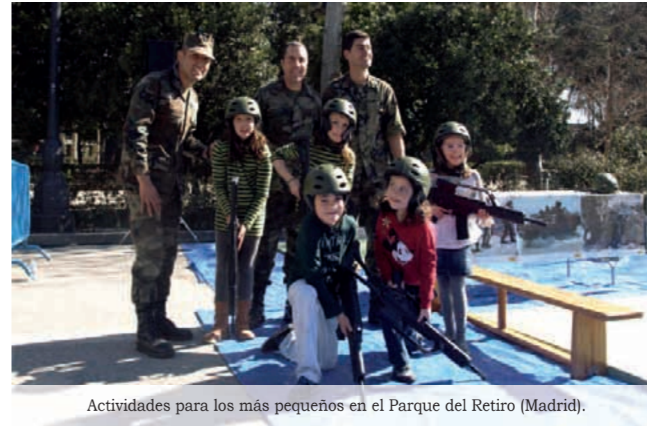
Actividades para los más pequeños en el Parque del Retiro (Madrid).

El domingo 19, desde las 12:00 y hasta las 15:00 horas, tuvo lugar una Jornada de Puertas Abiertas en la Agrupación de Infantería de Marina de Madrid (Arturo Soria, 291), con la intervención de la Unidad Canina y de los Equipos Operativos de Seguridad (EOS). Además se prepararon dos exposiciones sobre armamento, material, y vehículos de la Infantería de Marina, así como la evolución a lo largo del tiempo de los uniformes. Para finalizar la mañana dominical, se invitó a los asistentes a la degustación de un cocido madrileño.