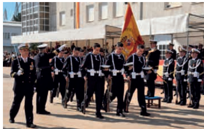
E.E. ANTONIO DE ESCAÑO

El capitán de navío Comandante-Director, Federico Supervielle Pérez, tomó juramento a 35 marineros de la Escuela de Especialidades «Antonio de Escaño» y a 27 marineros de la Escuela de Especialidades Fundamentales de la Estación Naval de «La Graña». También juraron bandera siete civiles.