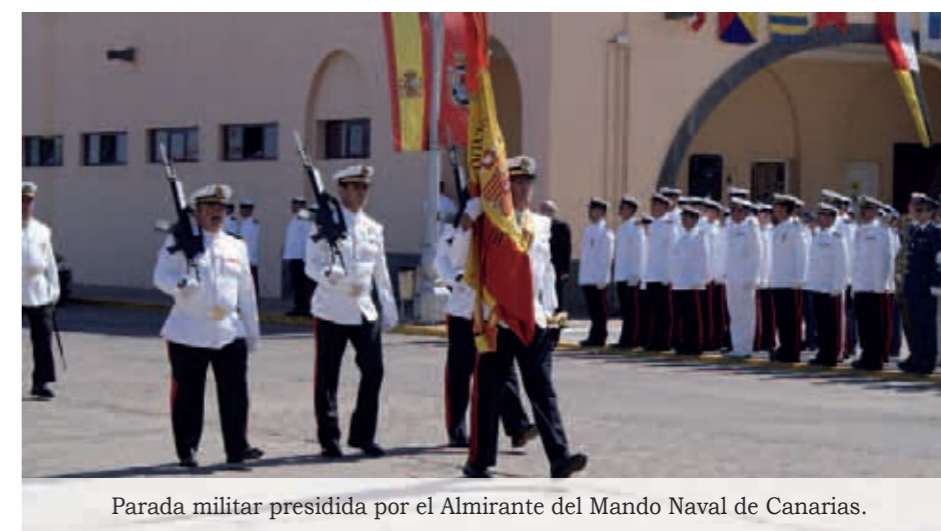
Parada militar presidida por el Almirante del Mando Naval de Canarias.