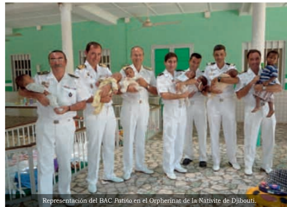
Representación del BAC Patiño en el Orpherinat de la Nativite de Djibouti.

El orfanato, que forma parte de la Misión Católica de Djibouti, atiende a unos cuarenta niños de muy corta edad. La Madre irlandesa del orfanato recibió a los marinos españoles agradeciendo la donación.