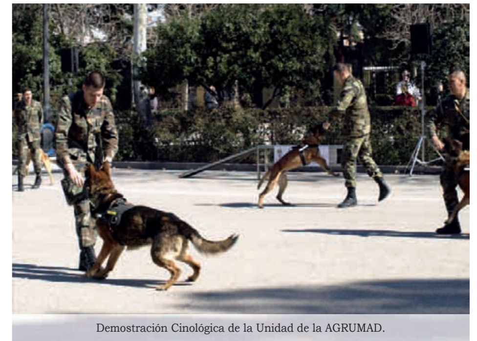
Demostración Cinológica de la Unidad de la AGRUMAD.