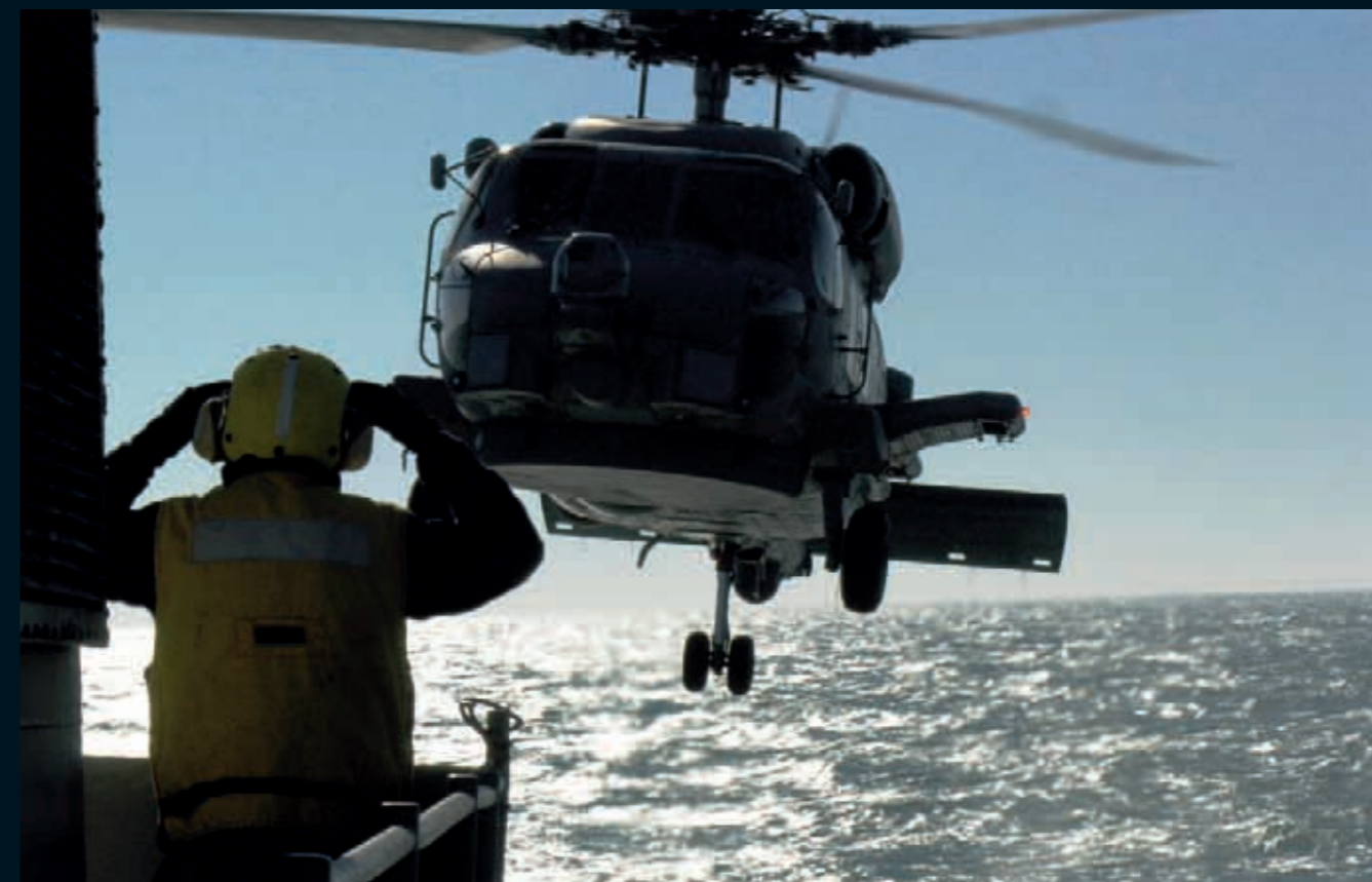
Trabajo en equipo.