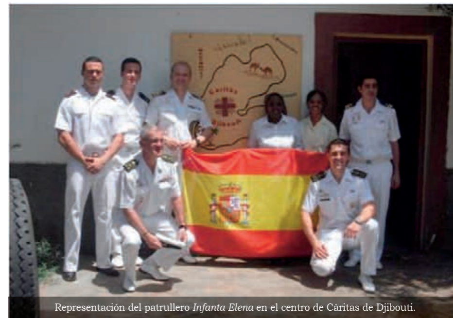
Representación del patrullero Infanta Elena en el centro de Cáritas de Djibouti.

recogido en Cartagena medicinas donadas de forma altruista por particulares y centros farmacéuticos.