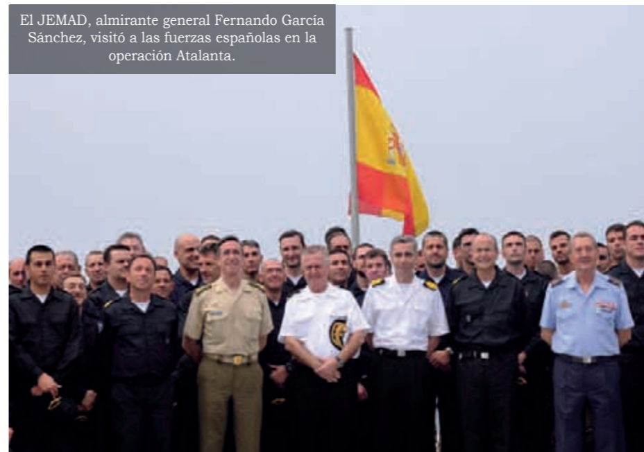
El JEMAD, almirante general Fernando García Sánchez, visitó a las fuerzas españolas en la operación Atalanta.

mantuvieron una reunión a bordo del pesquero Alakrana, donde tuvieron oportunidad de compartir con su dotación las difíciles experiencias vividas durante el secuestro sufrido el pasado año, así como la situación actual de la piratería desde el punto de vista de los armadores y capitanes de los barcos pesqueros.