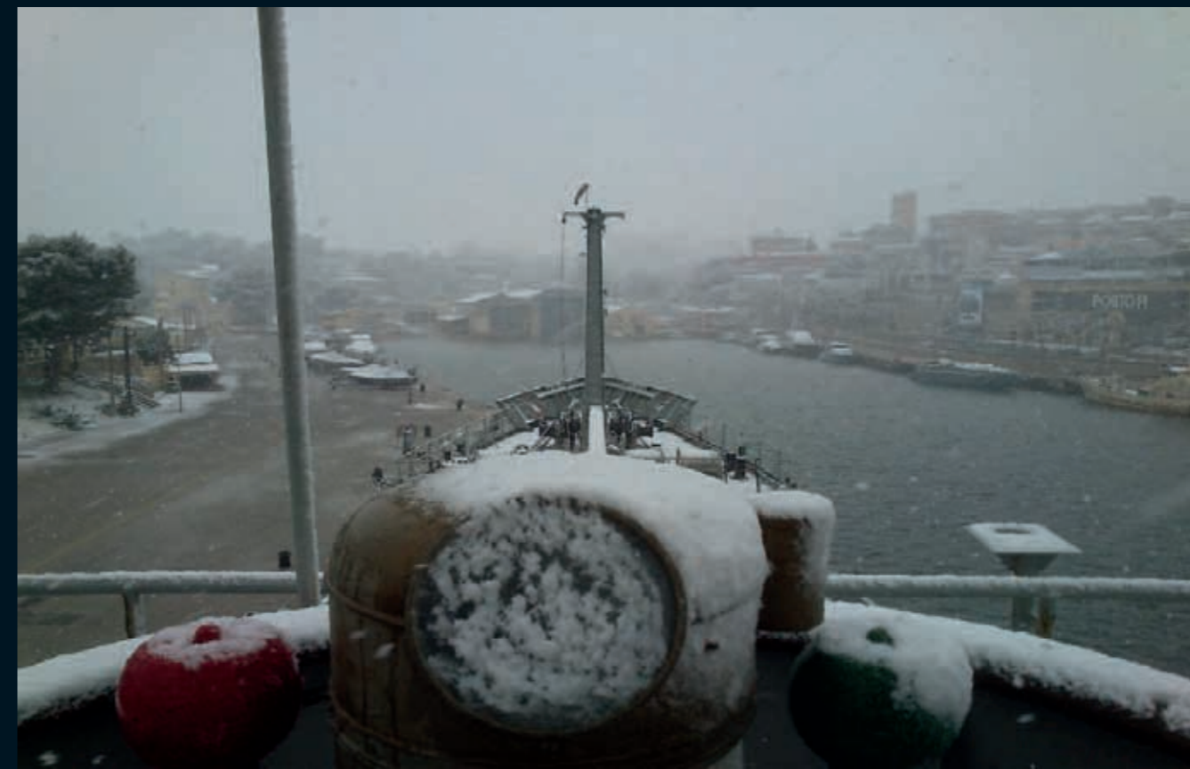
Recibimiento inesperado en Porto Pi.