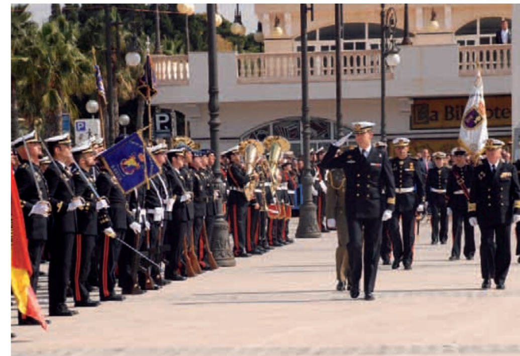
SAR. pasa revista a la Fuerza.