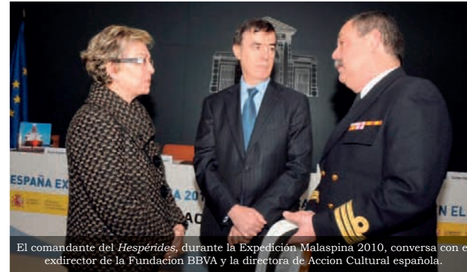
El comandante del Hespérides , durante la Expedición Malaspina 2010, conversa con el exdirector de la Fundación BBVA y la directora de Acción Cultural española.

La exposición organizada por el CSIC y AC/E, ofrece al visitante un recorrido por las diferentes facetas de las expediciones de exploración del océano global llevadas a cabo en los últimos quinientos años: las motivaciones, los desafíos, la tecnología usada y los resultados de investigación obtenidos durante las mismas.