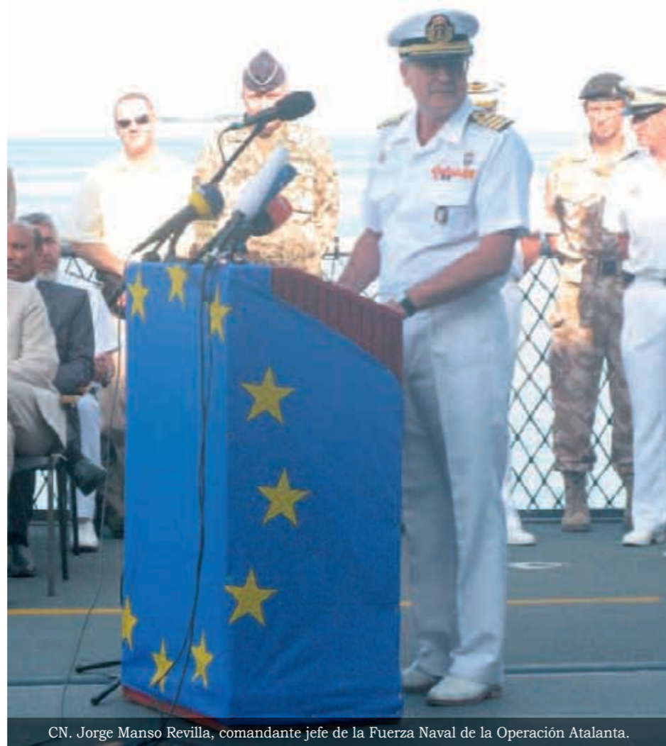
CN. Jorge Manso Revilla, comandante jefe de la Fuerza Naval de la Operación Atalanta.

oportunidad de plantear temas relacionados con la piratería y con el mando que actualmente ejerce, al tiempo que ofreció todo el apoyo de España y de la UE al gobierno de Seychelles. Así mismo se trató de iniciar un acuerdo entre ambos países para mejorar las condiciones en las que actualmente se encuentran tanto los pesqueros nacionales como sus equipos de seguridad con base en las islas del Índico. Posteriormente, el embajador y el contralmirante Manso