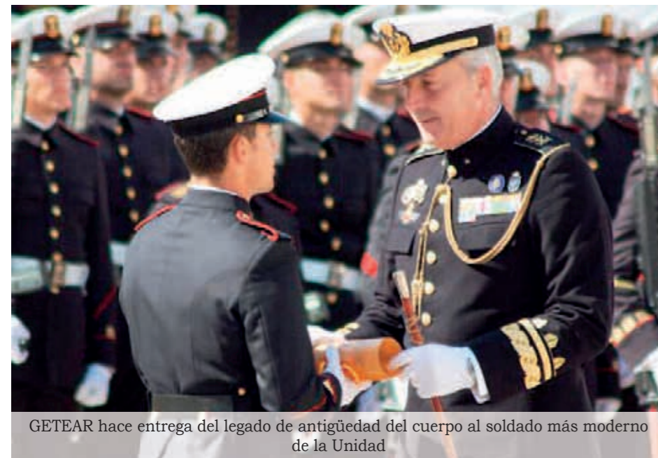
GETEAR hace entrega del legado de antigüedad del cuerpo al soldado más moderno de la Unidad

La Brigada de Infantería de Marina (BRIMAR) está compuesta por un Batallón de Cuartel General, dos batallones de desembarco, un Batallón Mecanizado de Desembarco, un Grupo de Artillería de Desembarco, una Unidad de Reconocimiento, un Grupo de Apoyo de Servicios de Combate y un Grupo de Movilidad Anfibia. Todo ello constituye un conjunto equilibrado de capacidades de combate, lo que, unido a su alto grado de alistamiento, la convierten en un instrumento idóneo para hacer frente a las posibles contingencias.