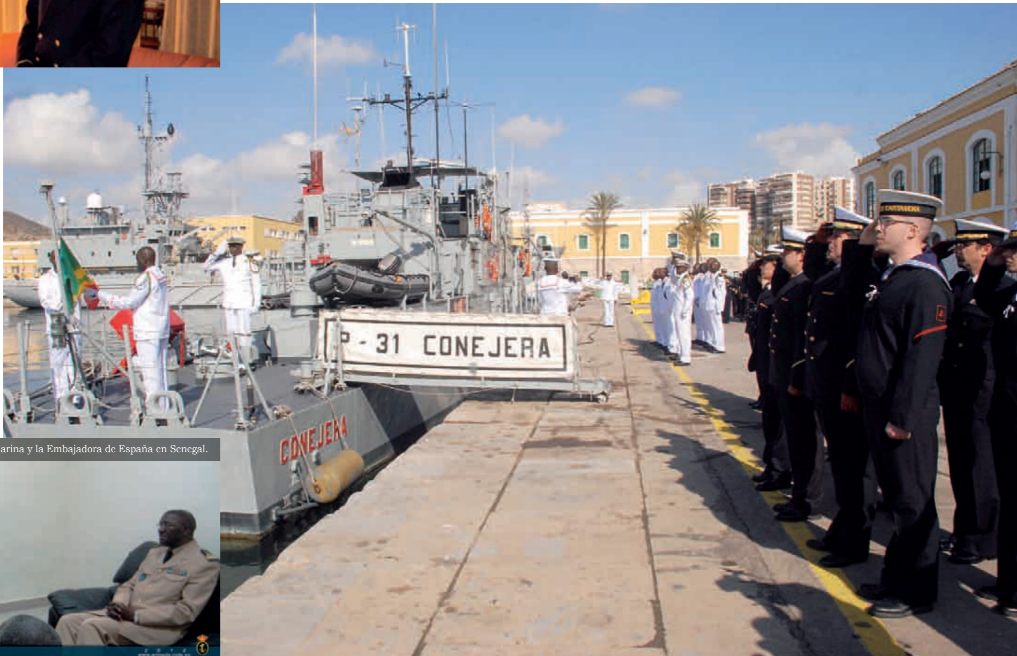
CA. Delgado con el jefe del Estado Mayor de la Marina y la Embajadora de España en Senegal.