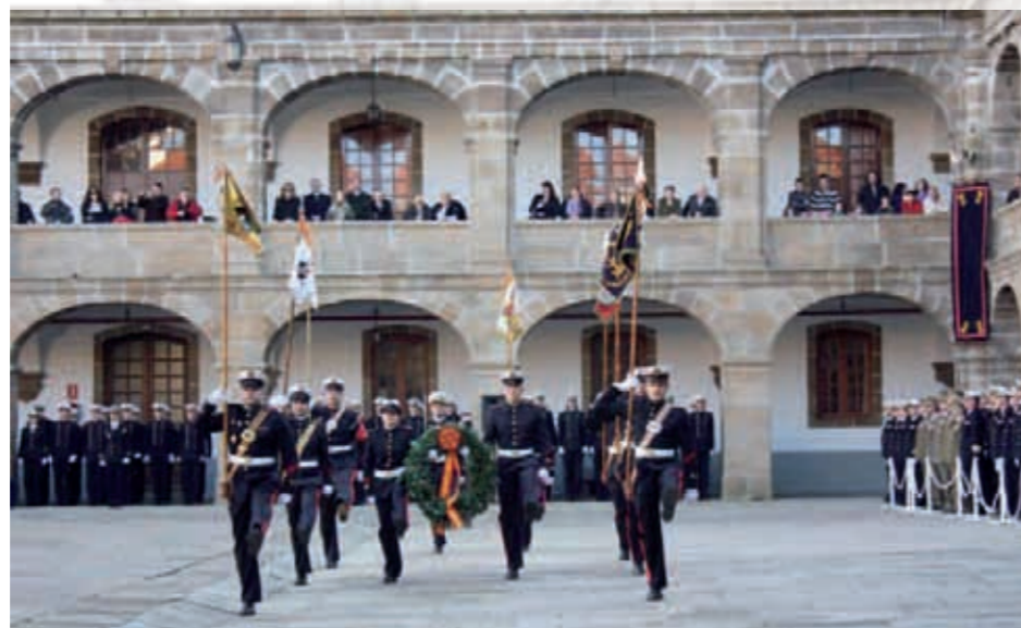
Homenaje a los Caídos que tuvo lugar en el TEAR.