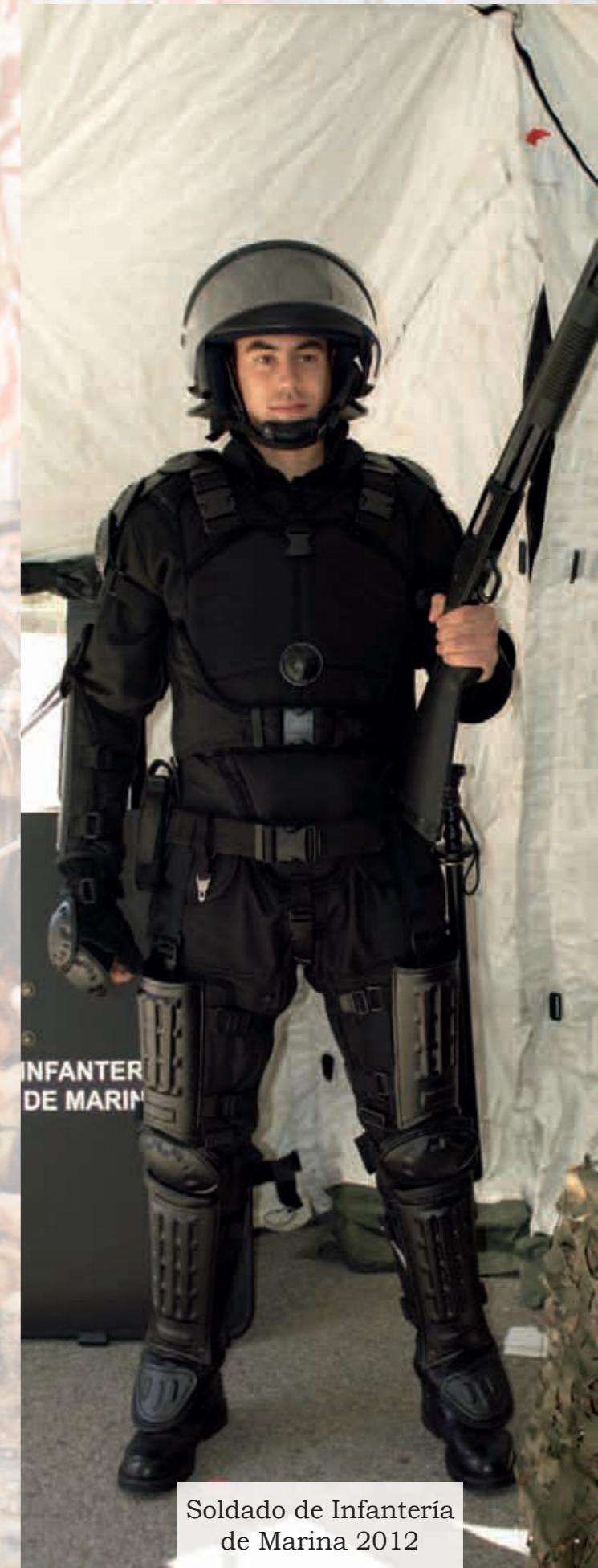
Soldado de Infantería de Marina 2012