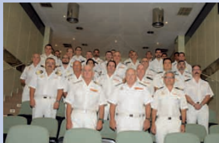
Miembros del CAPA y de la Secretaría Permanente que asistieron a la última sesión ordinaria de 2011 en el Cuartel General de la Armada.

El acto de clausura fue presidido por el Almirante, jefe de Personal, el cual, agradeció y felicitó a todos los Vocales del Consejo y al personal de la Secretaría Permanente por el trabajo desempeñado.