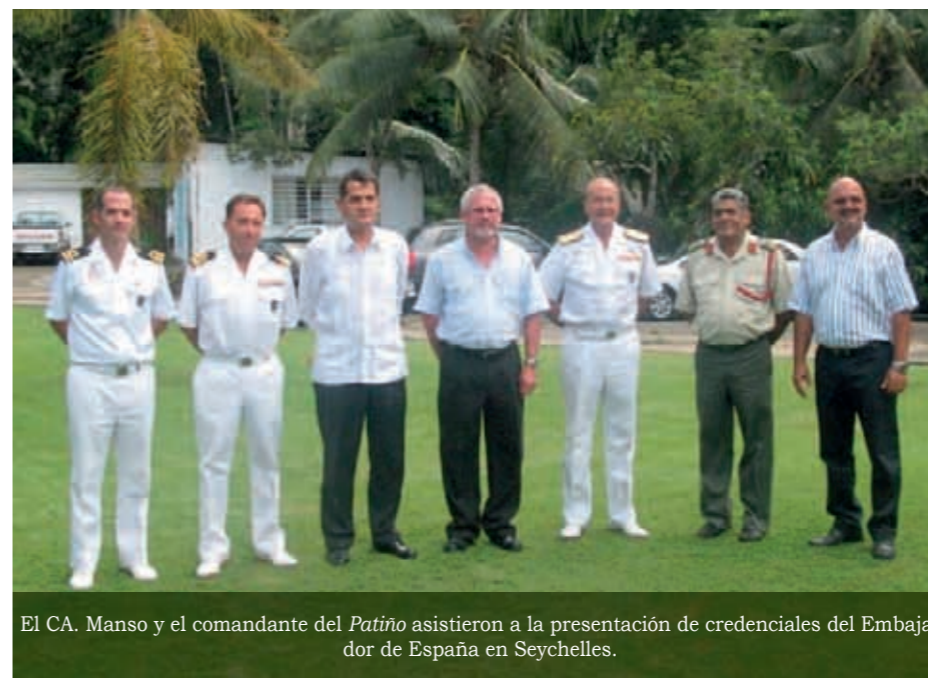
El CA. Manso y el comandante del Patino asistieron a la presentación de credenciales del Embajador de España en Seychelles.

parte de las diferentes fuerzas presentes, para ser juzgados y encarcelados. Los acuerdos entre España y la UE con Seychelles son positivos y se espera una mayor relación entre todos los implicados, a partir de la Conferencia, que tuvo lugar el día 23 de febrero en Londres, relativa al conflicto en Somalia. España y la UE han ofrecido todo su apoyo para que Seychelles continúe siendo una referencia para los países de la zona en lo relacionado con la lucha contra la piratería.