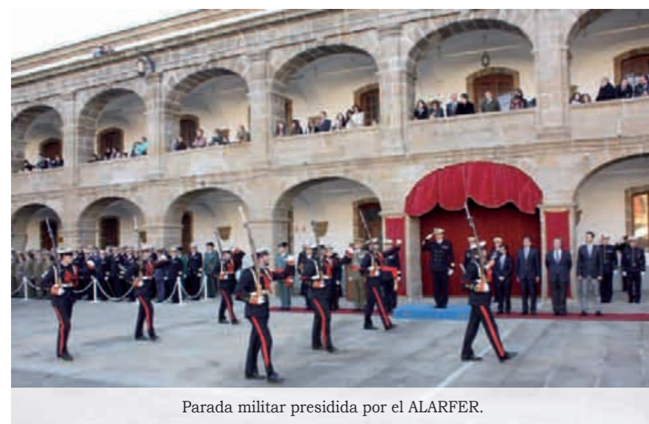
Parada militar presidida por el ALARFER.