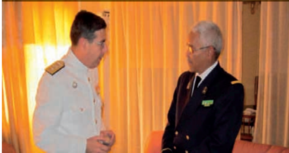
Almirante Comandante del mando naval de Canarias con el Director de la Marina Nacional de Mauritania.

dos fases: una primera en puerto, para adiestramiento multilateral, enfocado principalmente en las Operaciones de Interdicción Marítima (MIO); y una segunda en la mar, para practicar procedimientos de abordaje y registro de buques, intercambio de información y coordinación desde un Centro de Operaciones Marítimo, situado en Calabar (Nigeria).