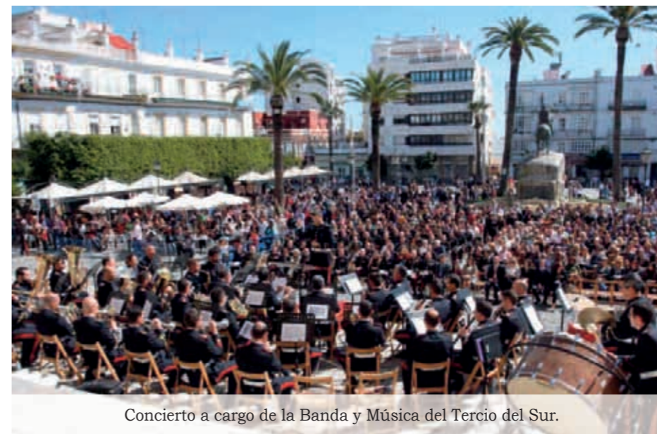
Concierto a cargo de la Banda y Música del Tercio del Sur.