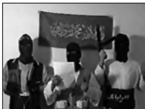
Figura 2. – Célula salafía yihadía de los atentados de 11-M en Madrid.

mentalmente, por un conjunto de razones y motivos que desde el punto de vista ideológico-religioso se sustentan en una particular interpretación del Corán y la creencia de que el libro sagrado ampara toda esa barbarie, de un Estado y situación de violencia y terror. Por lo que este tipo de violencia ha llegado a convertirse en la actualidad en un fenómeno verdaderamente incomprensible y absolutamente irracional para cualquier modelo de sociedad cuyo fin primordial y natural es sobrevivir, figuras 1 y 2.