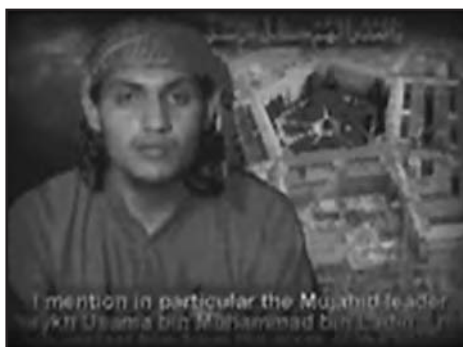
Figura 1. – Miembro de una de las células terroristas de 11-S en Nueva York.