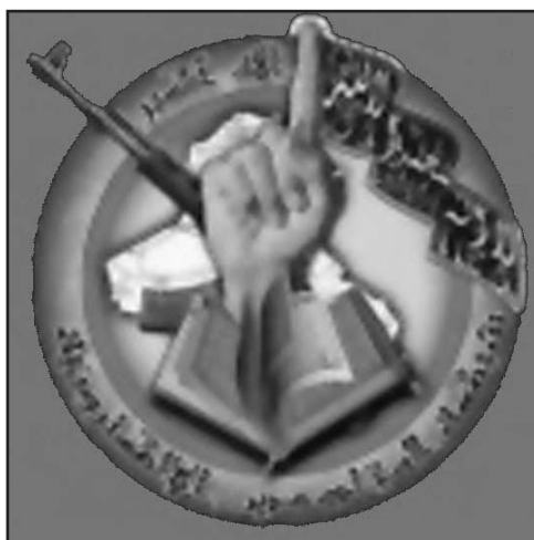
Figura 4.- Frente Islámico: Yihad Global.

mulmanas y lugares sagrados– sean atacados o invadidos por extranjeros. Casos en los que el llamamiento a realizar la yihad se considera una obligación individual para todo musulmán para la defensa de los territorios (Azzam, 1987 y Azzam, 1993).