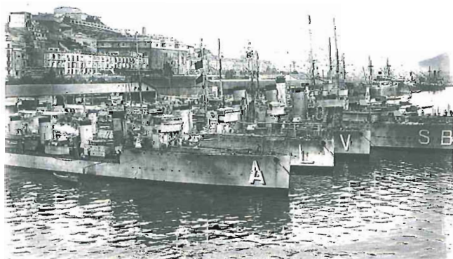
Grupo de destructores en Cartagena, 1929 (AGA, Alfonso, Sig. 019591).

El estudio y análisis de los Archivos Diplomáticos sirve para documentar ampliamente todos estos acontecimientos bélicos. De entre todos ellos destacan: