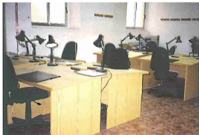
Sala de Investigadores

Los fondos documentales que actualmente custodia el Archivo son los siguientes: