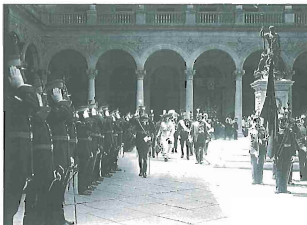
Los Reyes Alfonso XII y Victoria Eugenia, en el acto de entrega de la bandera donada por la Reina a la Academia de Infantería, 1931 (AGA, Alfonso, Sig. 021241).

Fruto de las últimas transferencias del Ministerio de Defensa en la década de los 90 son las 3.216 cajas del máximo órgano de la justicia militar española, que ha sufrido importantes cambios en su denominación desde su creación en el siglo XVI.