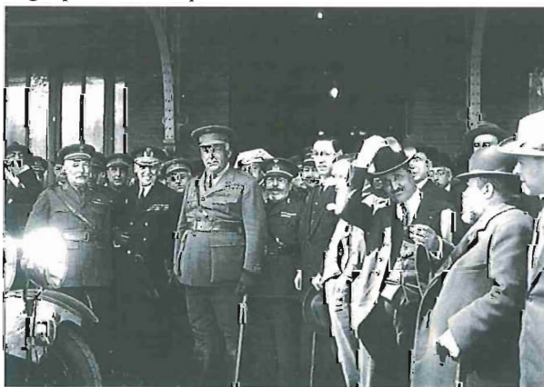
Llegada de Primo de Rivera a África, 1925.

El Archivo Central del Ministerio de la Presidencia transfirió 1840 cajas de la Junta Calificadora de Aspirantes a Destinos Civiles (1945-1983) . Contiene expedientes personales de militares destinados en dicha Junta, en varias situaciones administrativas: Retirados, Colocados, Agrupación Temporal Militar.