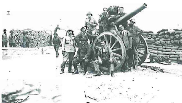
Primer cañón de largo alcance “Verdes Montenegro” empleado en Marruecos, 1925 (AGA, Alfonso, Sig. 012927).

publicado en la “Prensa del Movimiento”, cuyo intervalo cronológico se retrasa a inicios del siglo XX al adquirir el Estado diversas editoriales tras la Guerra Civil Española, cuyos archivos gráficos pasaron a formar parte de órganos del Movimiento Nacional.