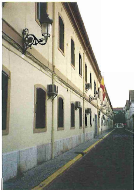
Fachada del Archivo

Posteriormente, mediante Real Decreto 1132/1997, de 11 de Julio, se reestructuró la