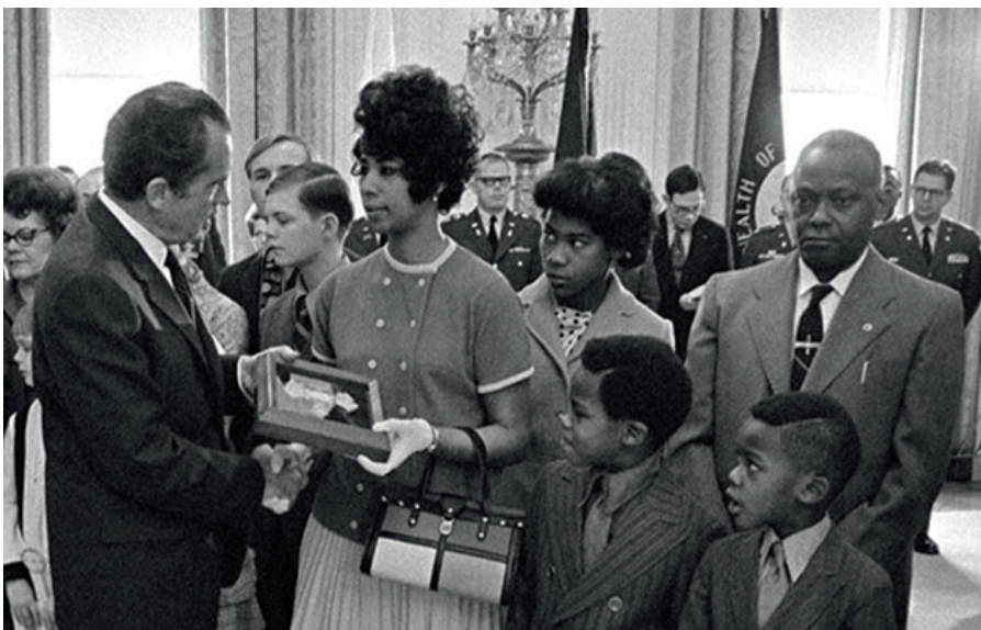
El presidente Nixon entregando la Medalla de Honor a título póstumo a la familia de SFC W. Bryant, el 16 de febrero de 1971

Sus actos de preocupación por sus camaradas, entrega y audacia aún a costa de su propia vida, son reflejo de los más altos estándares de la tradición militar y honran no solo a él sino también a su unidad y al Ejército de Los Estados Unidos.