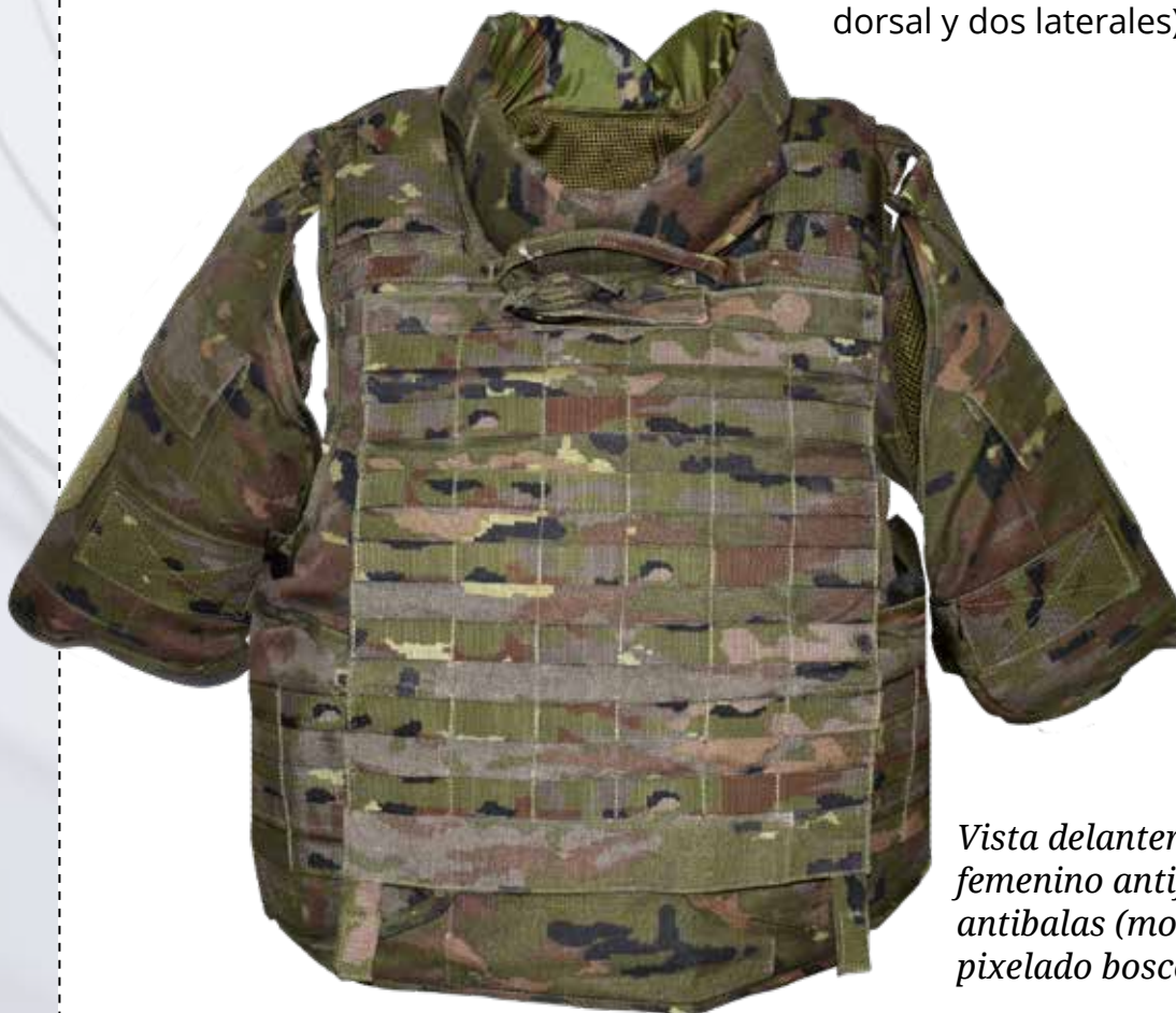
Vista delantera del chaleco femenino antifragmento antibalas (modalidad 2018), pixelado boscoso